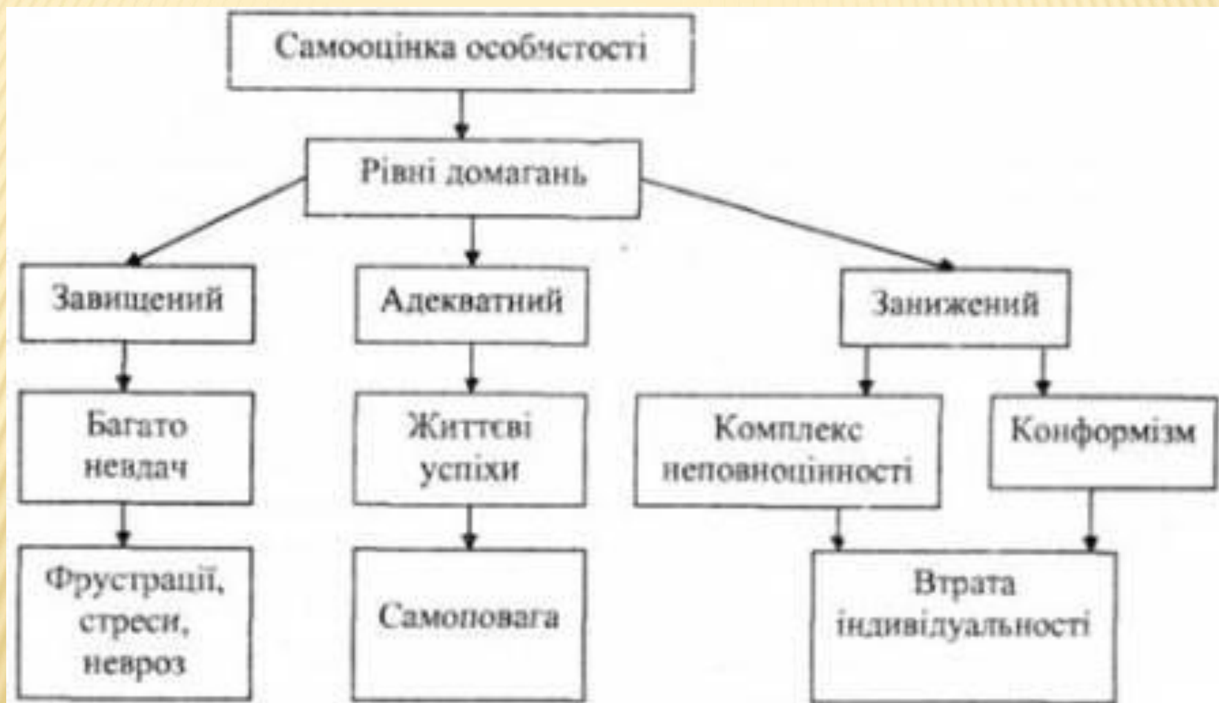
Рис. 10. Взаємозв'язок між рівнем самооцінки та рівнем домагань особистості