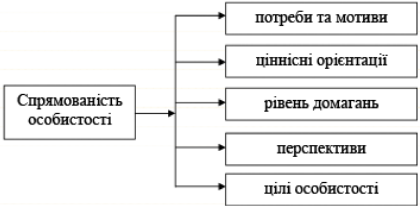
Рис. 2. Психологічні компоненти, які впливають на спрямованість особистості

Головним структурним компонентом особистості є її спрямованість як система спонукань, що визначає вибірковість ставлень та активності особистості.