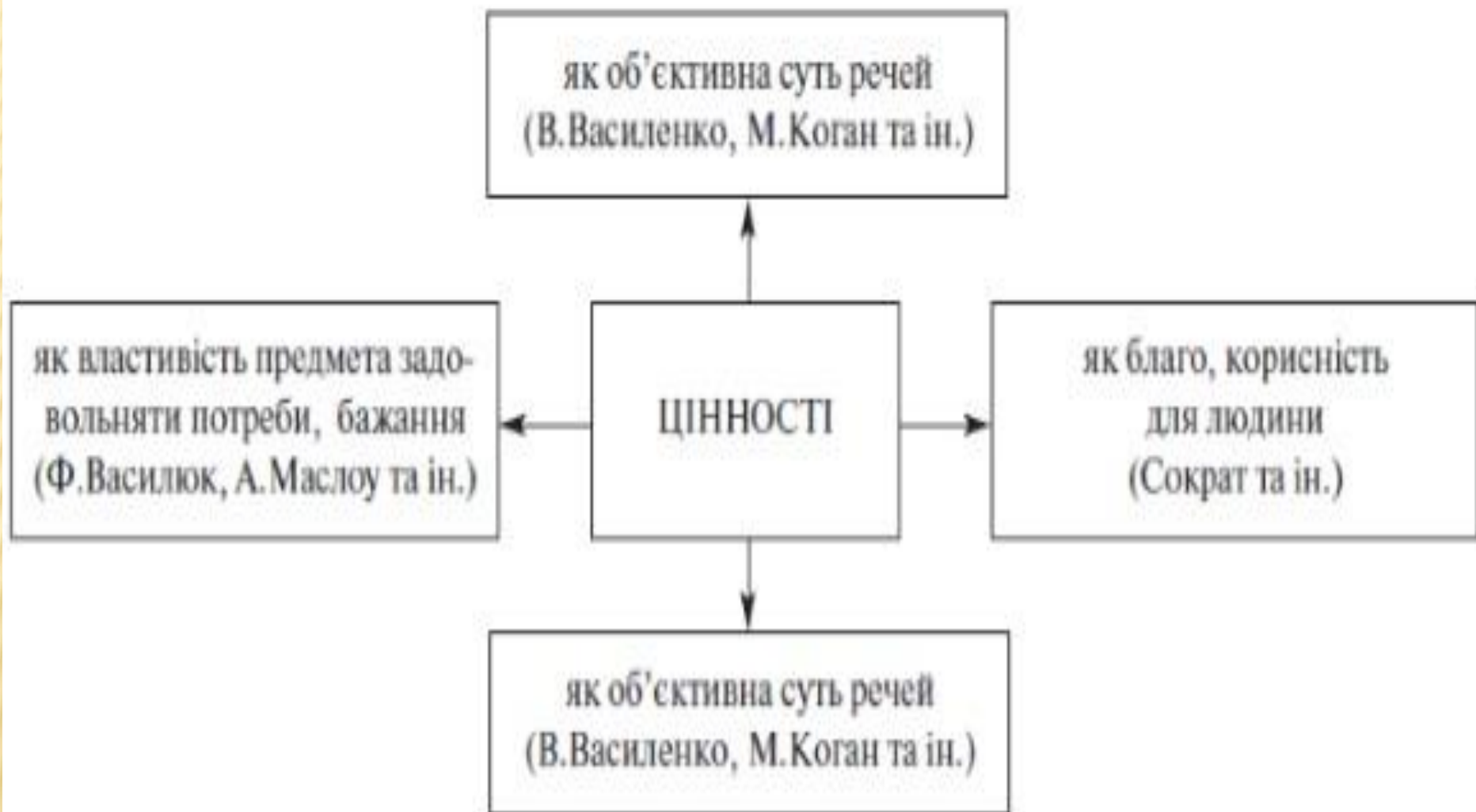
Рис. 1. Сутність поняття «цінності» (за матеріалами узагальнення літературних джерел)