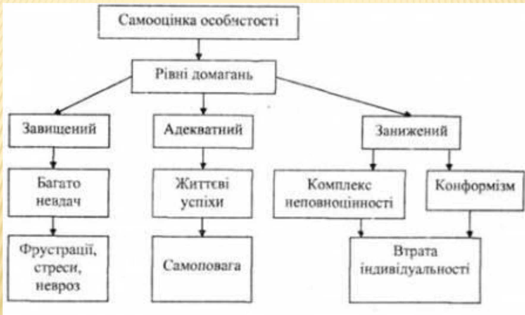
Рис. 10. Взаємозв'язок між рівнем самооцінки та рівнем домагань особистості