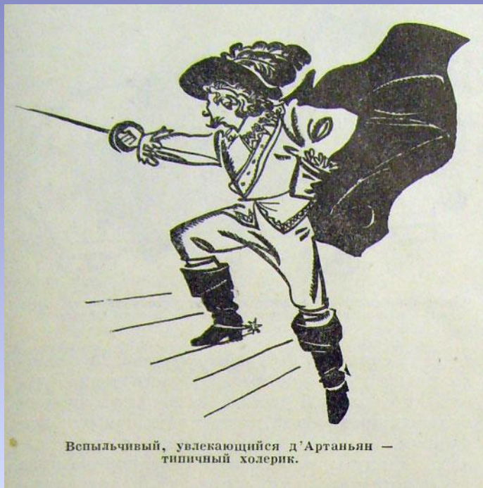
Вспыльчивый, увлекающийся д'Артаньян — типичный холерик.