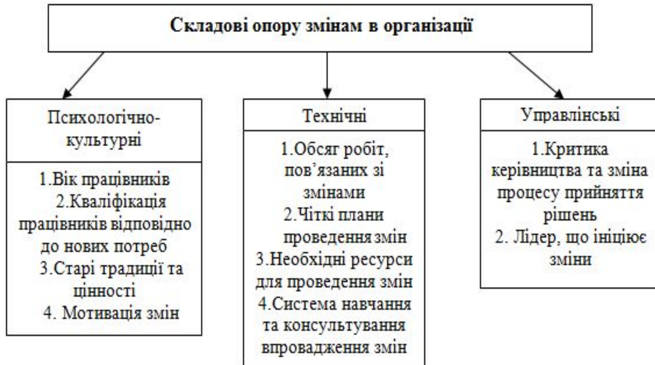
Рис. 5.1. Складові опору змінам в організації