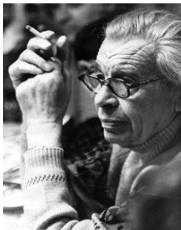
Д.Б. Эльконин (1904-1984)