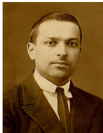
Л.С. Выготский (1896-1934)