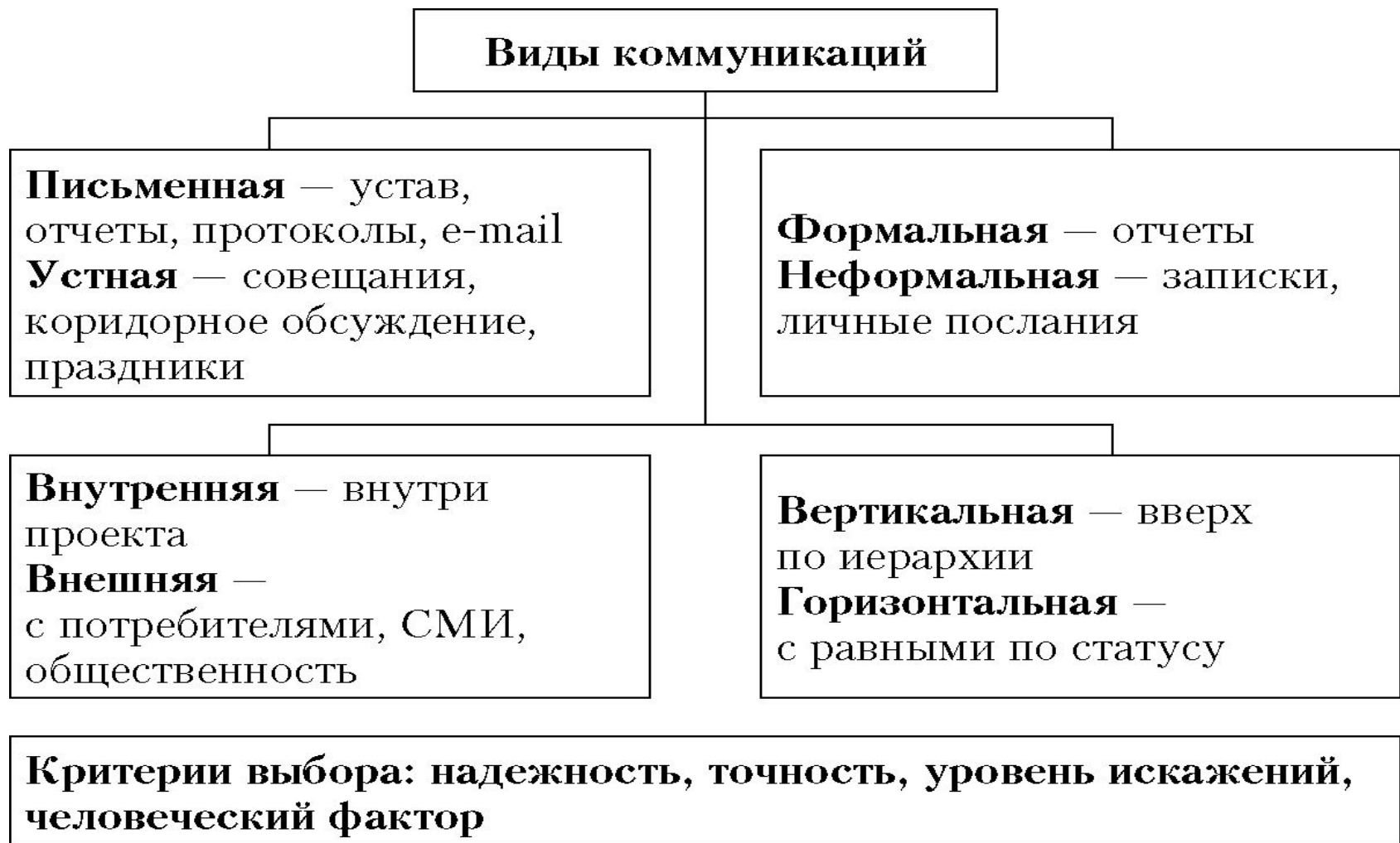
Рис. 2. Виды коммуникаций и критерии выбора коммуникационных технологий