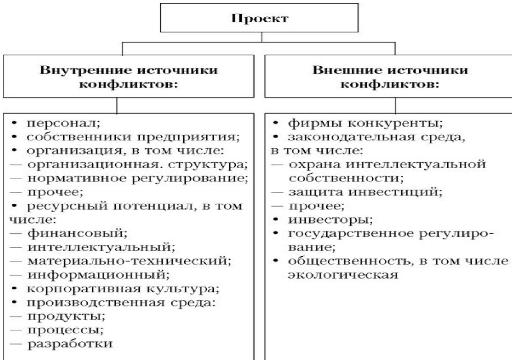
Рис. 3. Источники конфликтов при реализации проекта