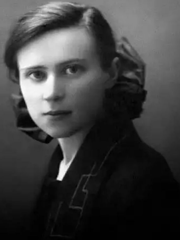
Зейгарник Блюма Вульфовна

(9.11.1900, г. Пренай, Литва - 24.02.1988, Москва)