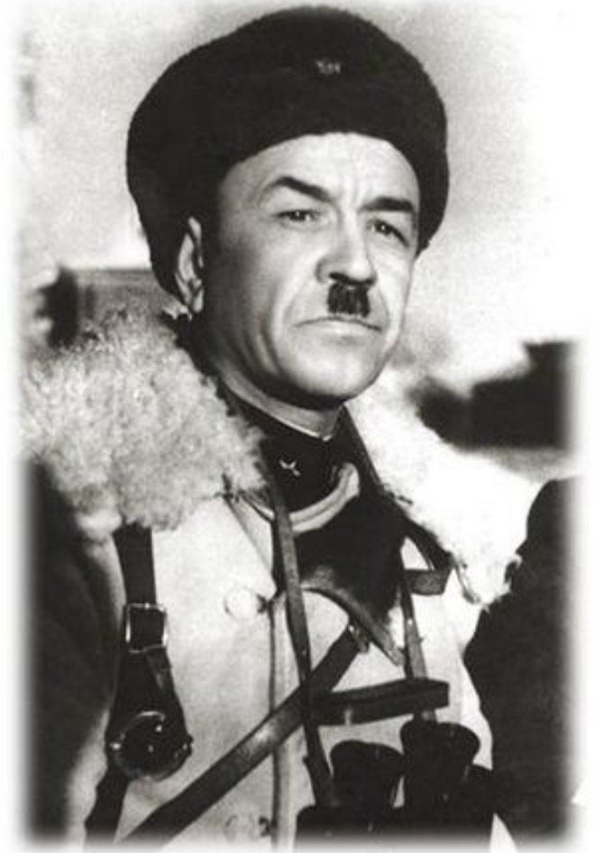
Генерал-майор И.В. Панфилов