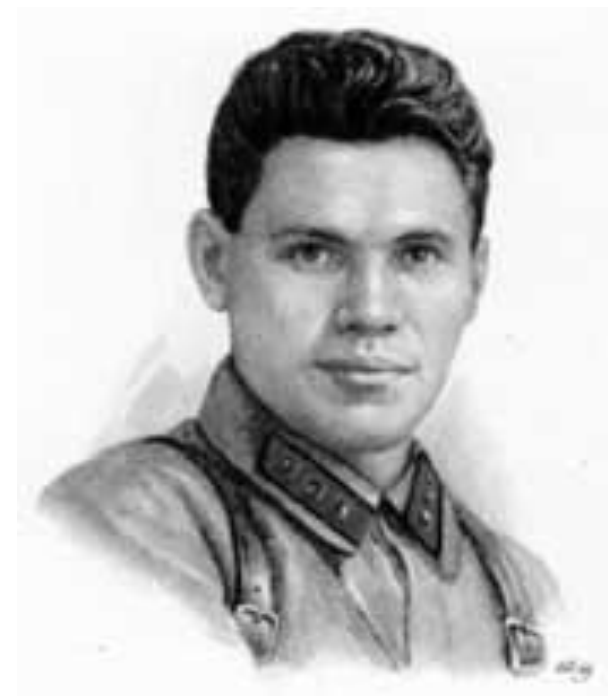
Герой Советского Союза В.Г.Клочков