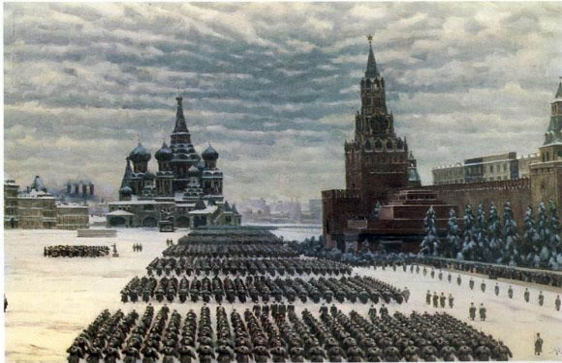
7 ноября 1941 г. на Красной площади состоялся военный парад. Его участники прямо с парада уходили фронт.