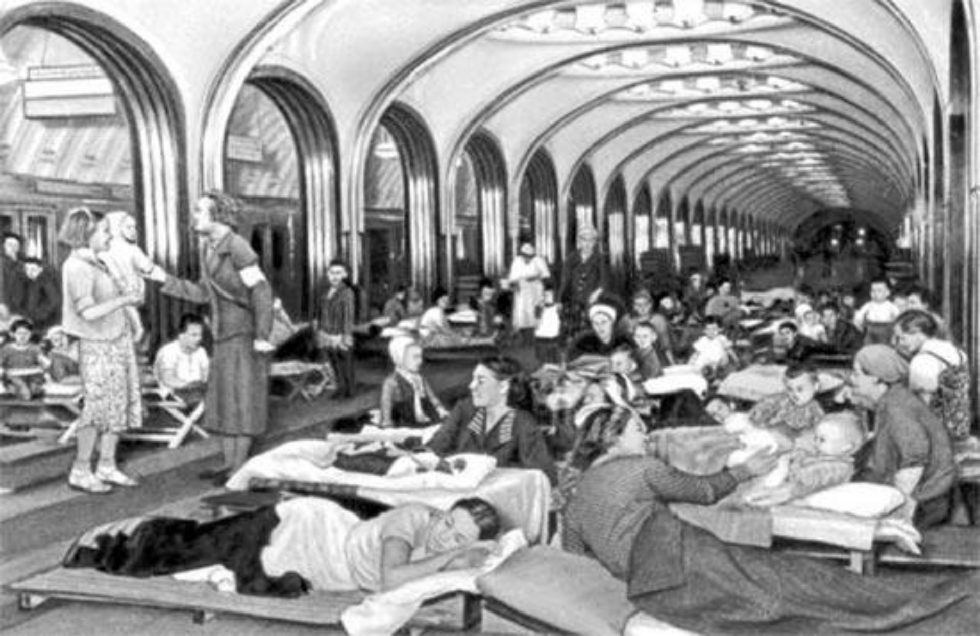
Дети, старики, женщины спускались в метро. Оно стало надежным укрытием.