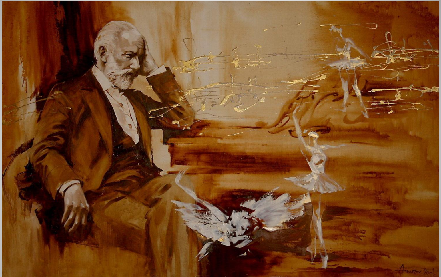
П. И. Чайковский (1840 – 1893)