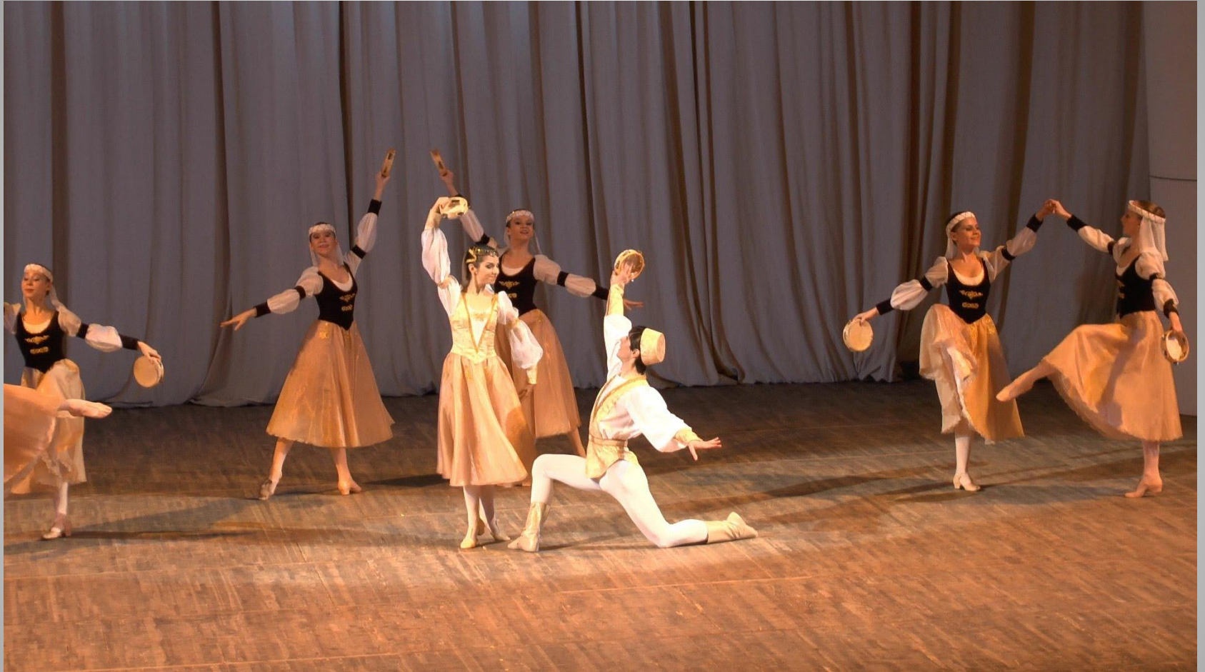
« Неаполитанский танец » из балета « Лебединое озеро » П.И. Чайковского.