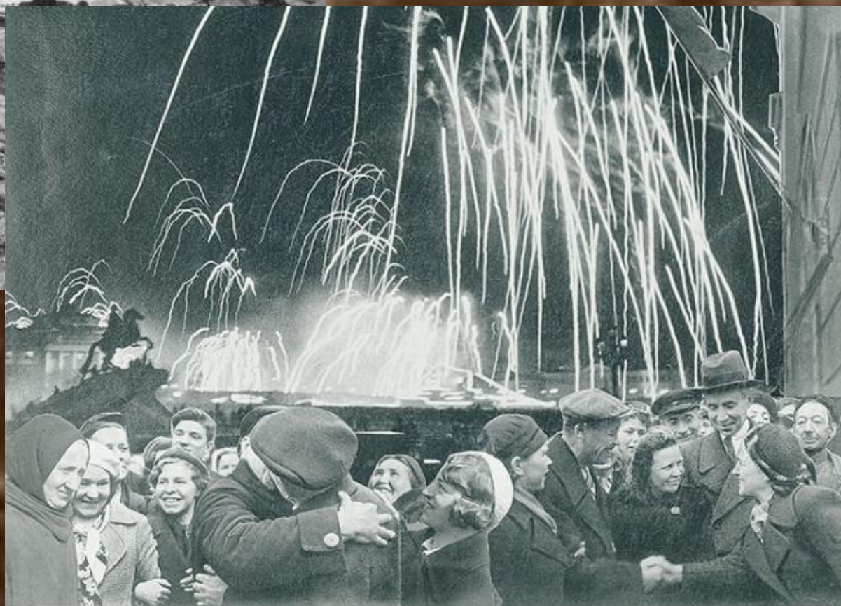
«Великая победа одержана советскими войсками под Ленинградом»: