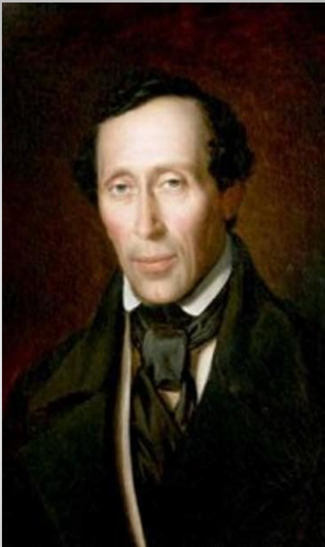
Ганс – Христиан Андерсен 1805 -1875 г.г.