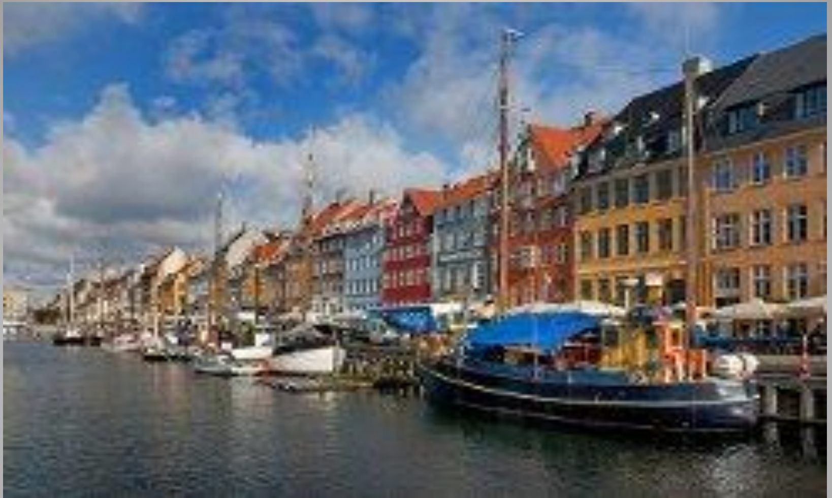
Город Оденс на острове Фюн