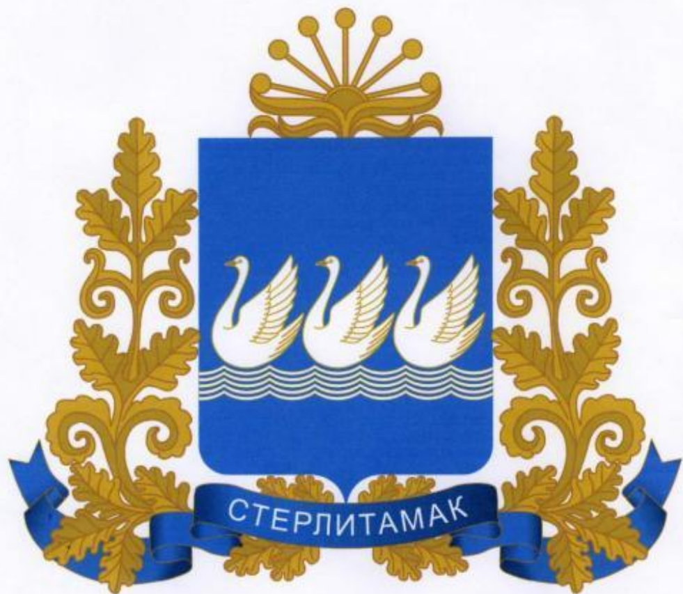
Герб города Стерлитамак

В сезоне-2004/05 годов попал в паралимпийскую сборную Башкирии по легкой атлетике, после чего по совету специалистов, переключился на лыжные гонки и биатлон.