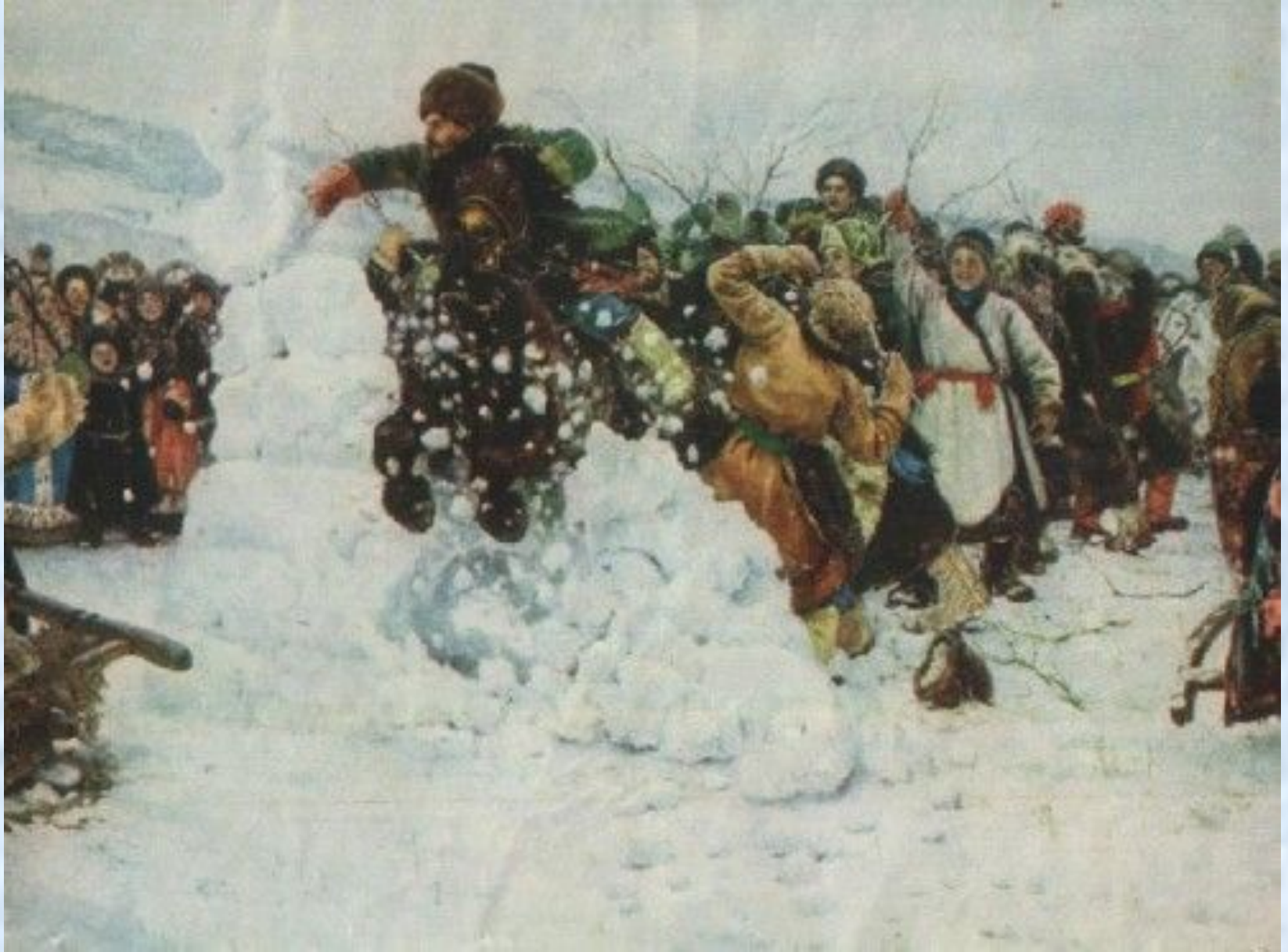
Суриков В. И. Взятие снежного городка. 1891г.