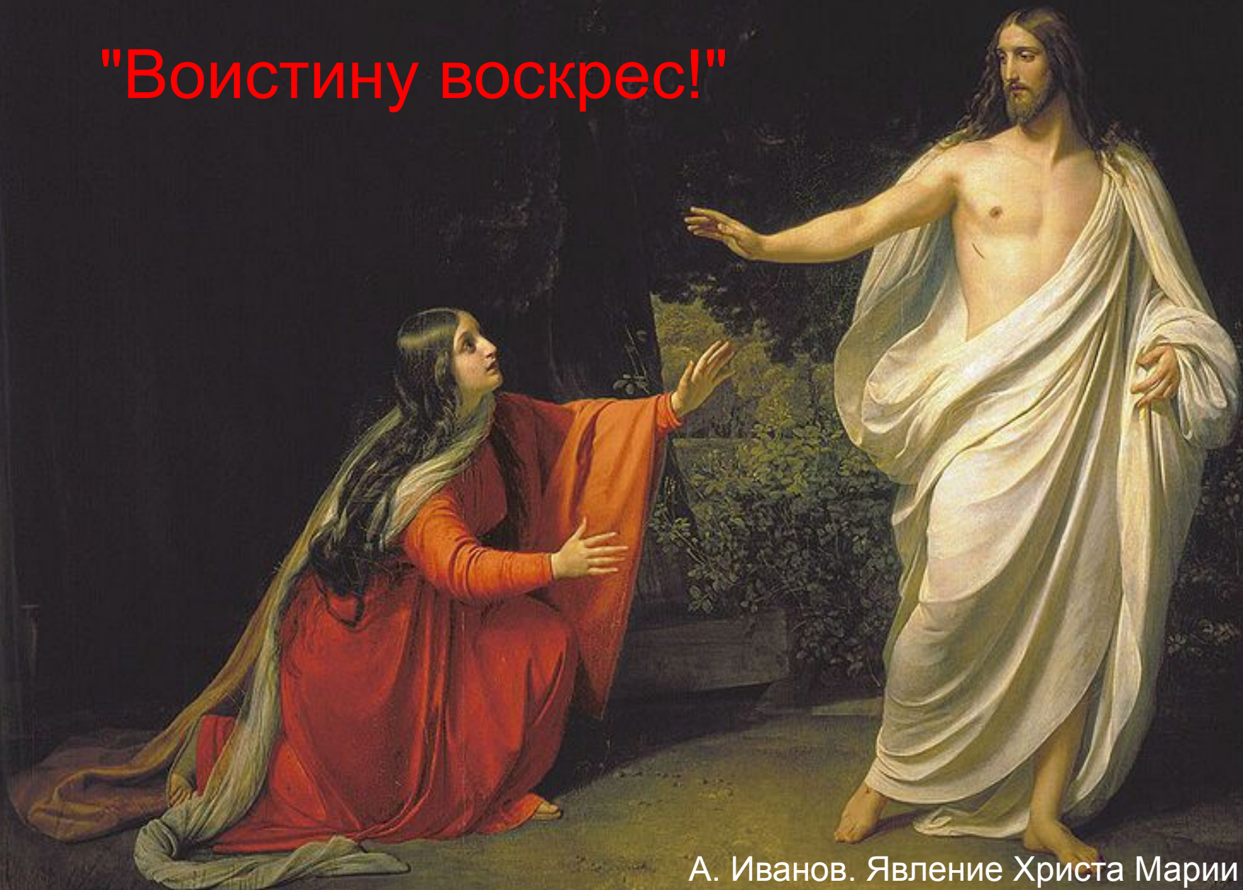
А. Иванов. Явление Христа Марии