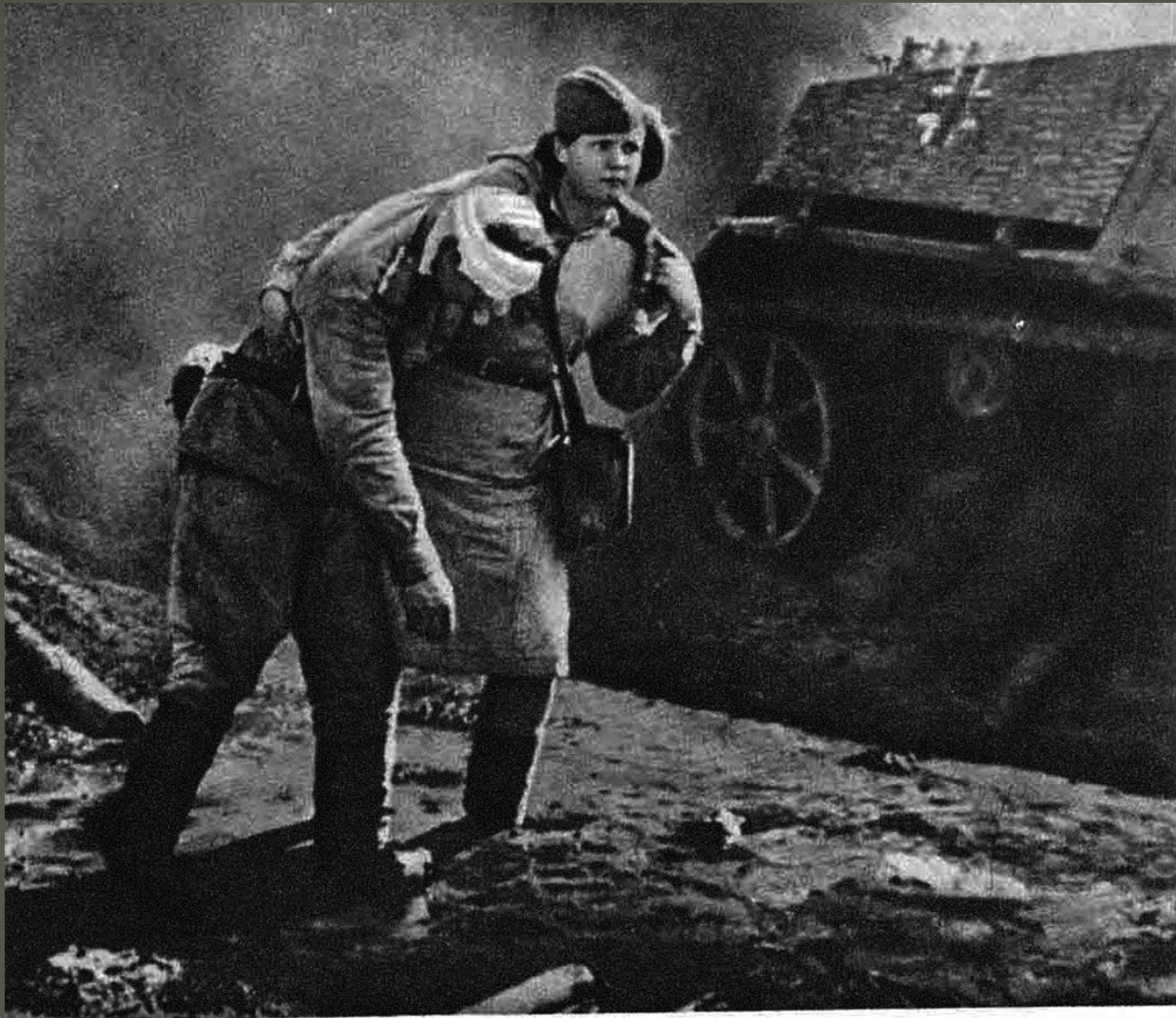
Спасая раненого воина...

Многих солдат спасли от смерти добрые женские руки.