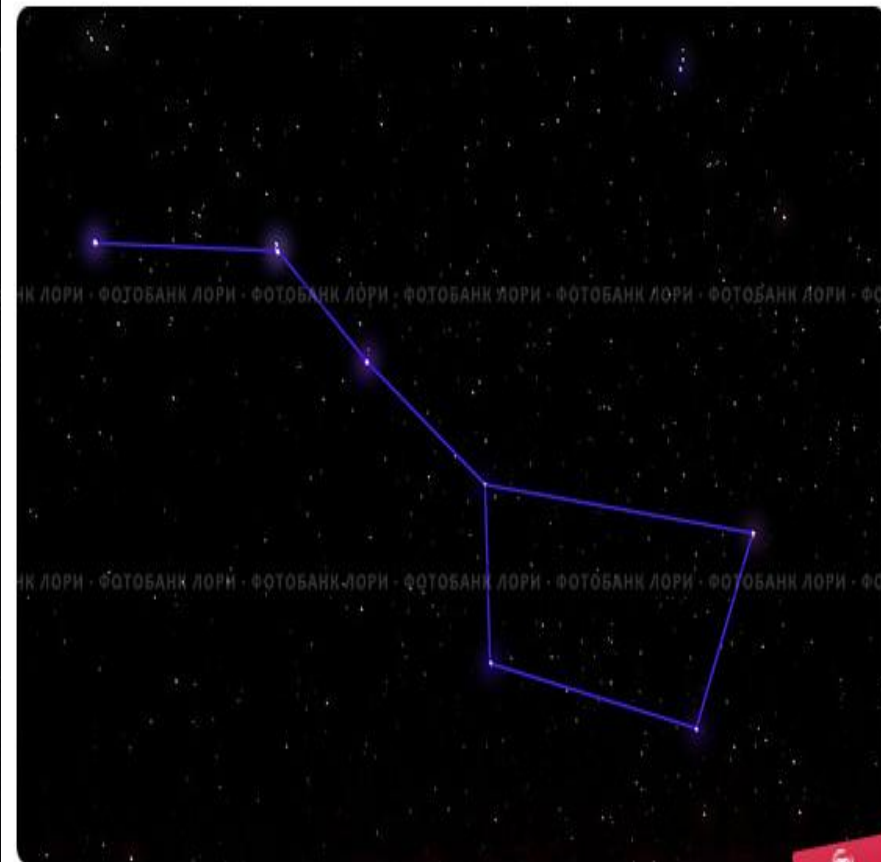
Созвездие Большой Медведицы