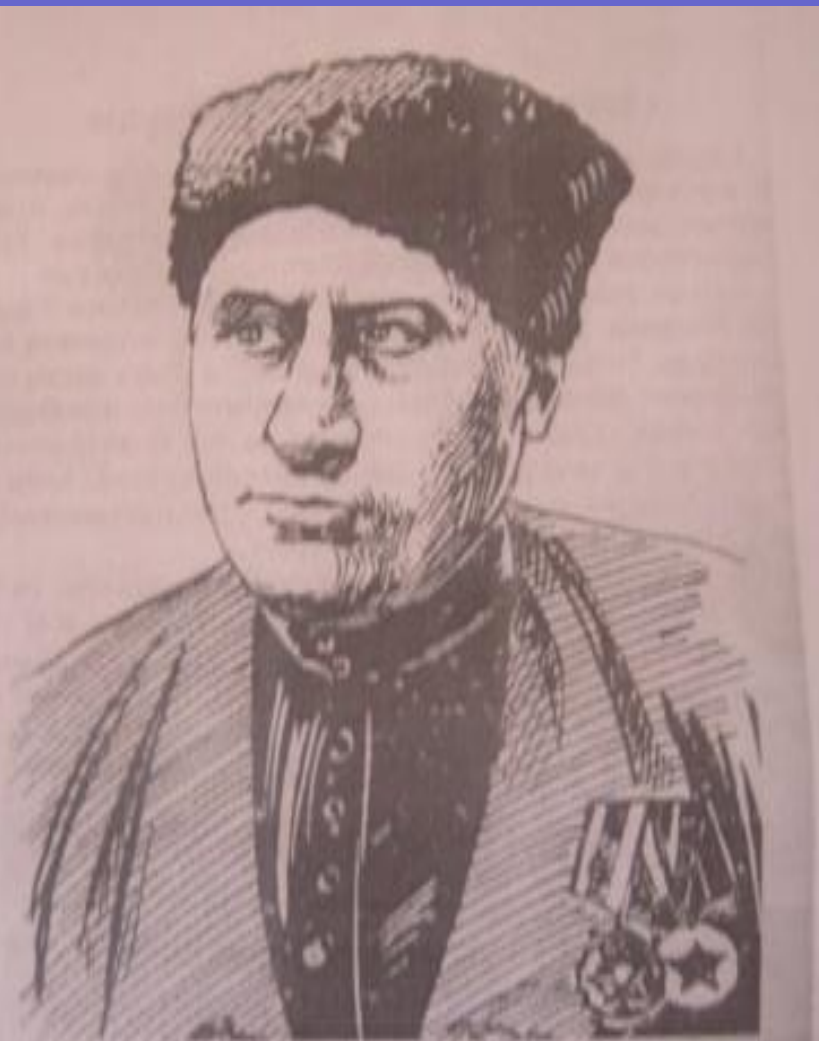
ГЕНЕРАЛ М.И. СУРЖИКОВ.