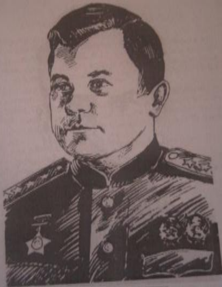
ГЕНЕРАЛ АРМИИ НИКОЛАЙ ФЕДОРОВИЧ ВАТУТИН

18 декабря 1901 года рождения. Генерал армии.