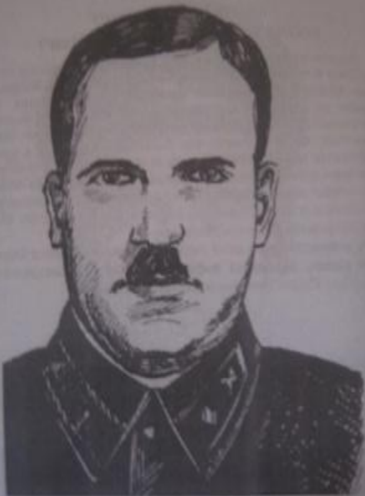
ГЕНЕРАЛ Ф.Я. КРЮКОВ