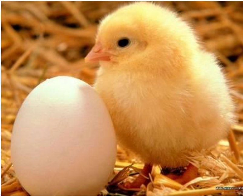
Яйцо и цыпленок