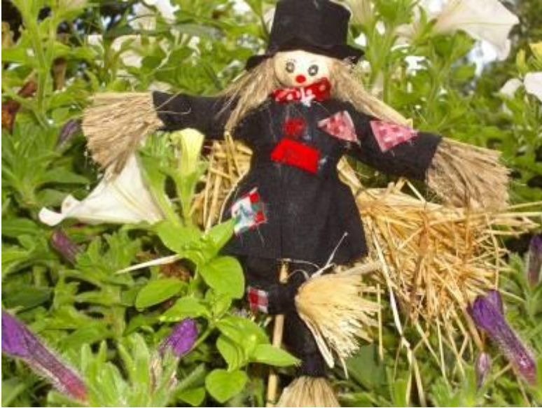
Птицы и пугало огородное