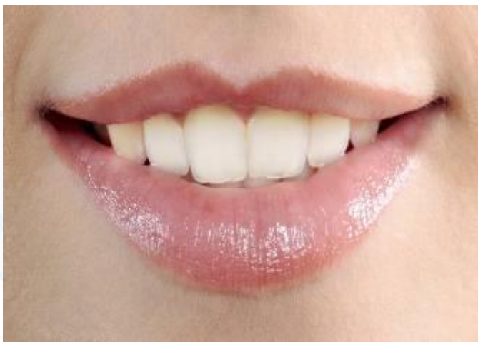
Губы и зубы