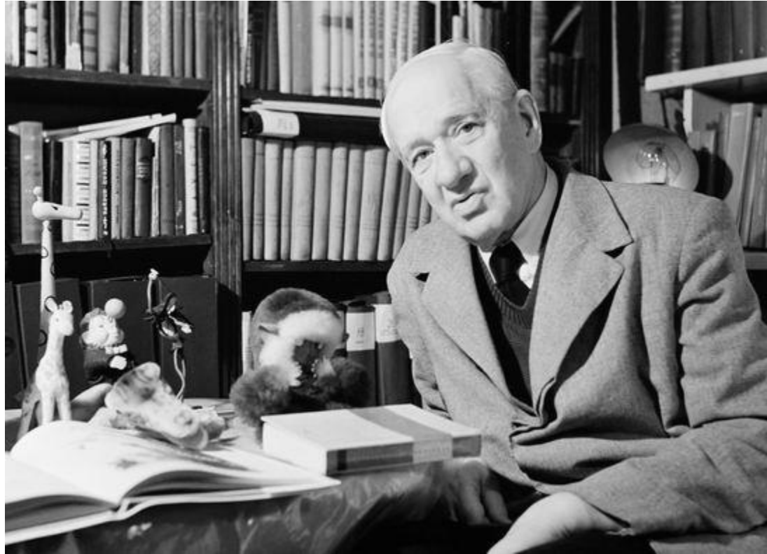
Корней Иванович Чуковский за работой.