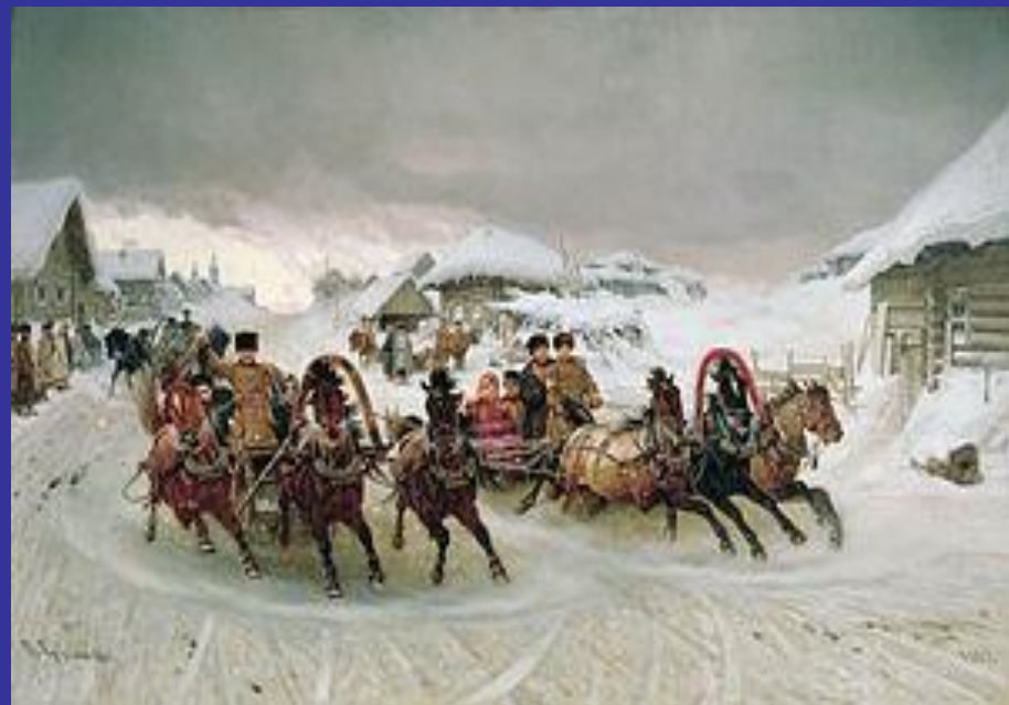
«Масленица». П. Н. Грузинский, 1889.