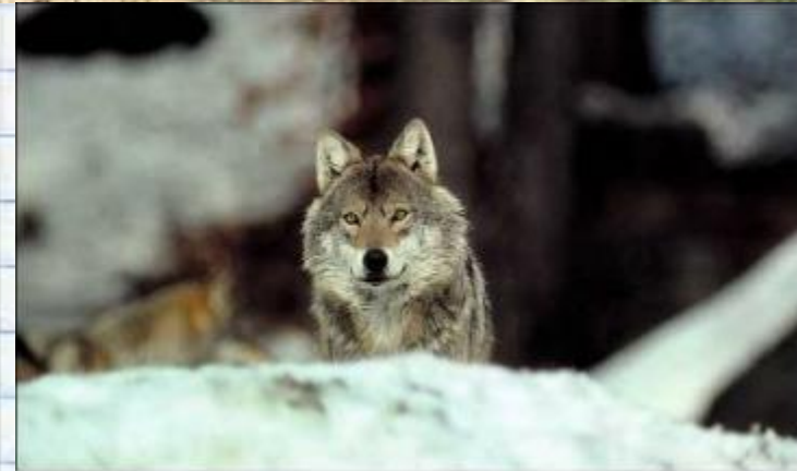
Волк - Canis lupus

Заяц, волк, лиса, выдра, лось, кабан не делают запасов на зиму. Они и так найдут себе корм.