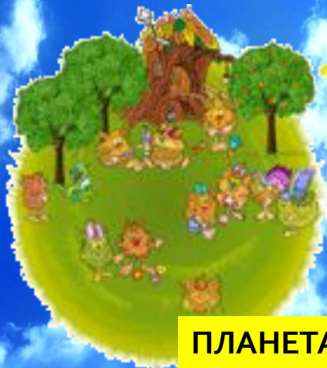
ПЛАНЕТА ВЕСЁЛЫХ МАТЕМАТИКОВ