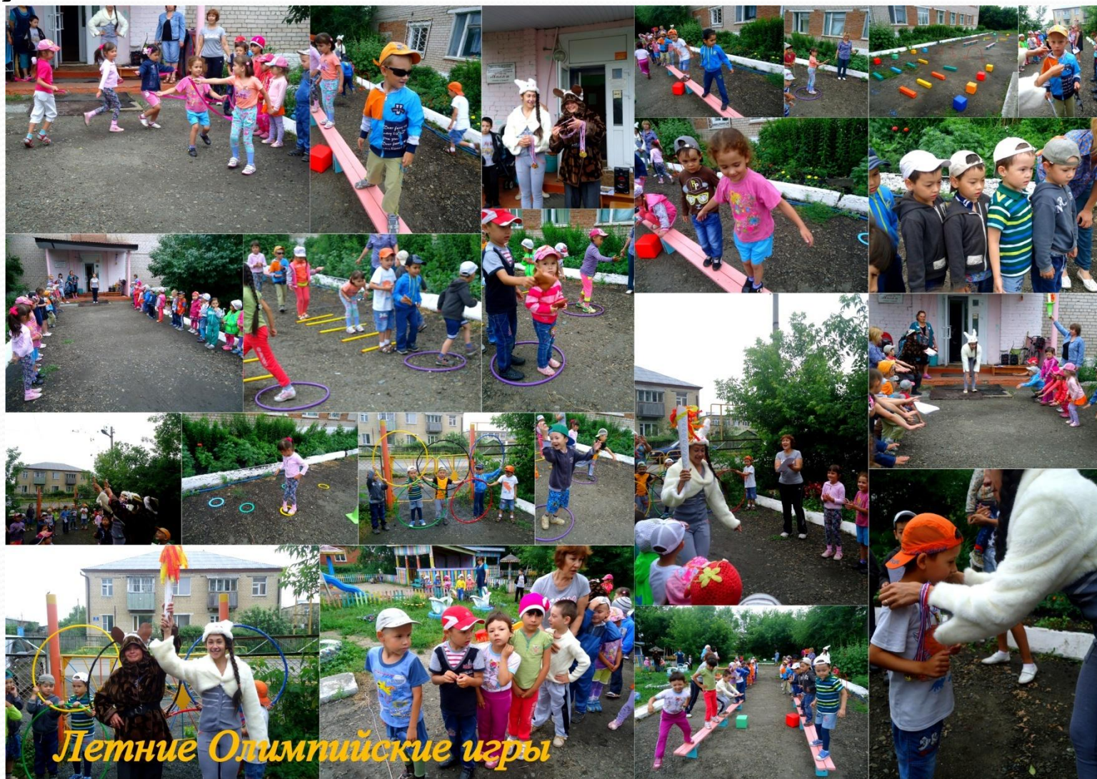
Летние Олимпийские игры