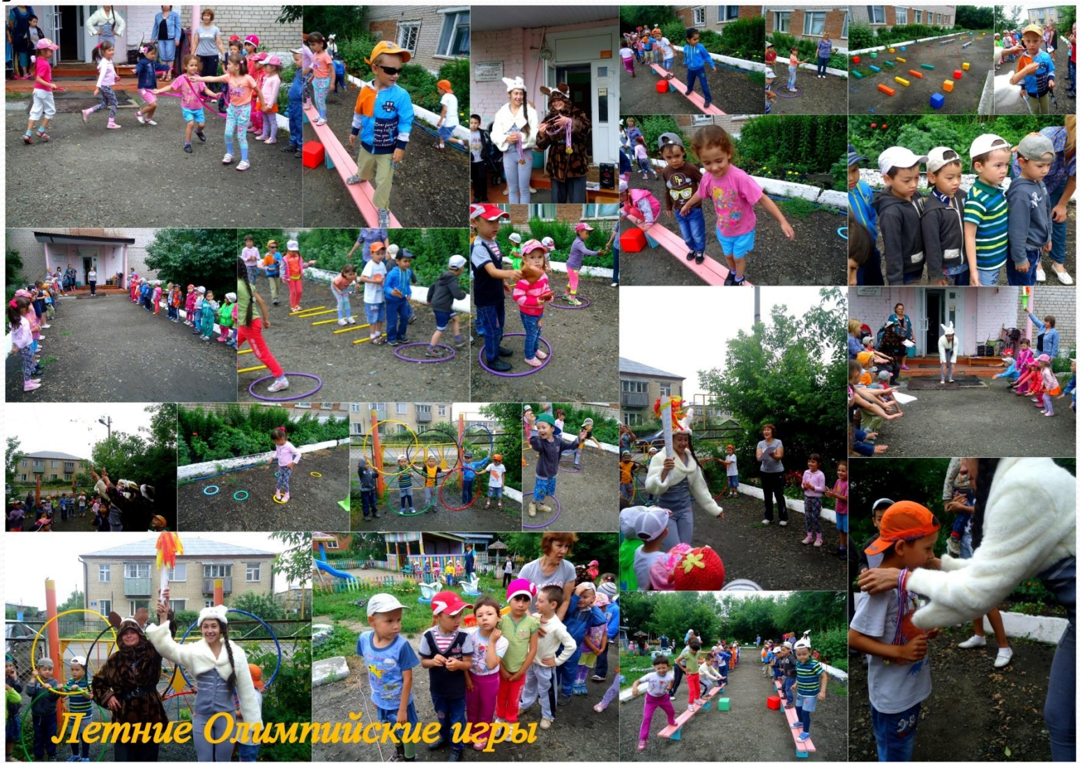
Летние Олимпийские игры