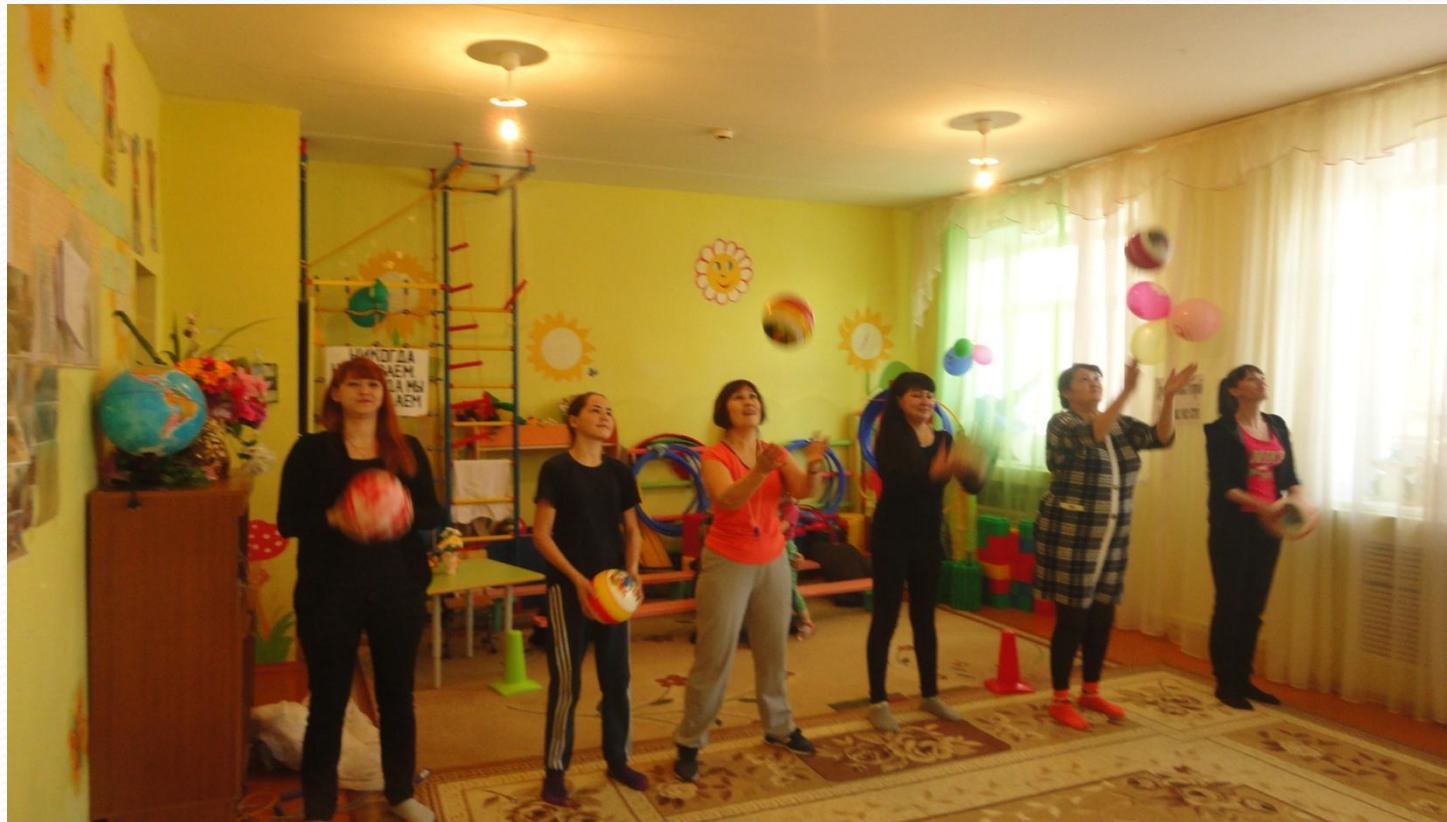
Мастер-класс «Школа мяча» для родителей.