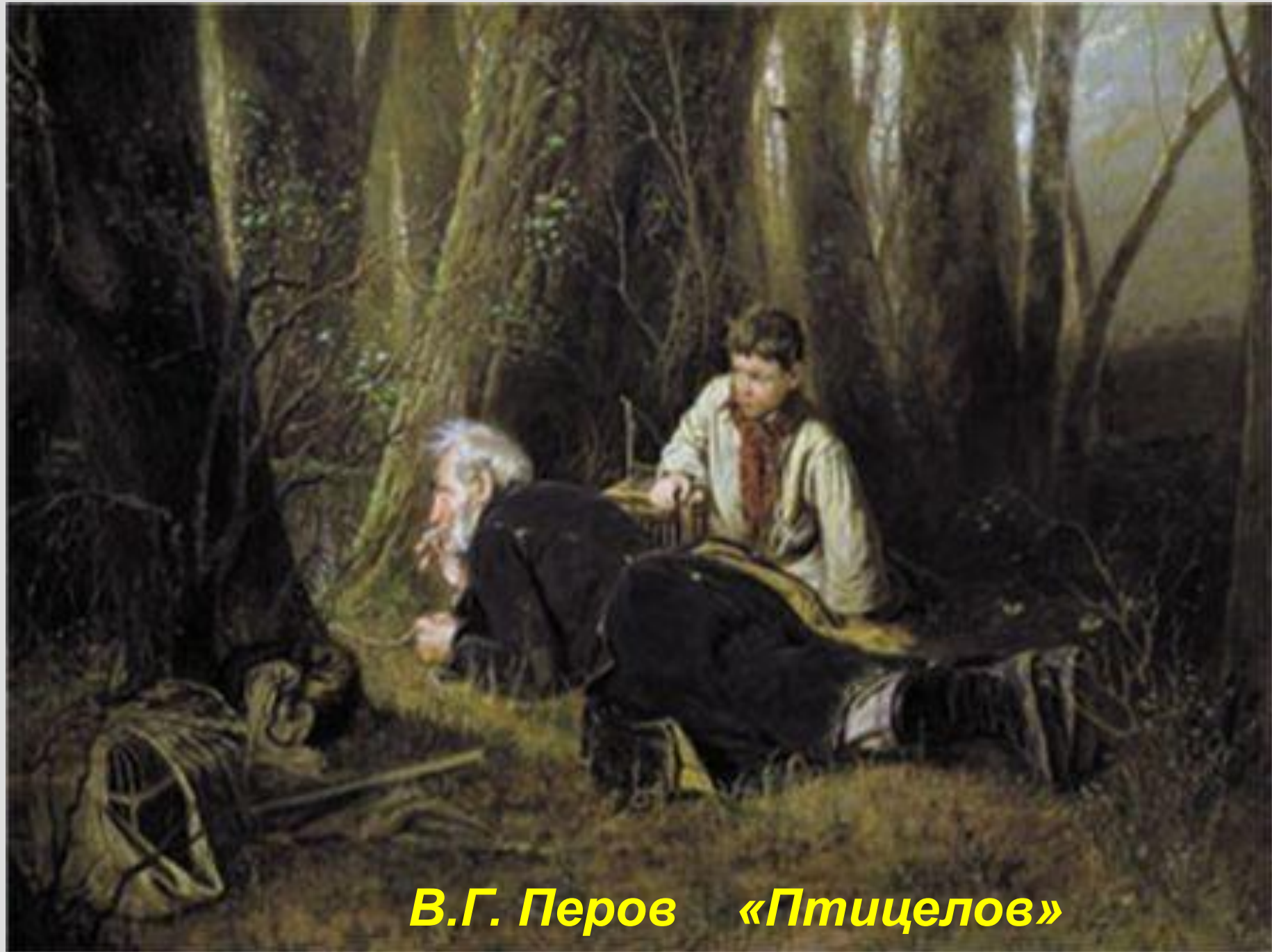
В.Г. Перов «Птицелов»