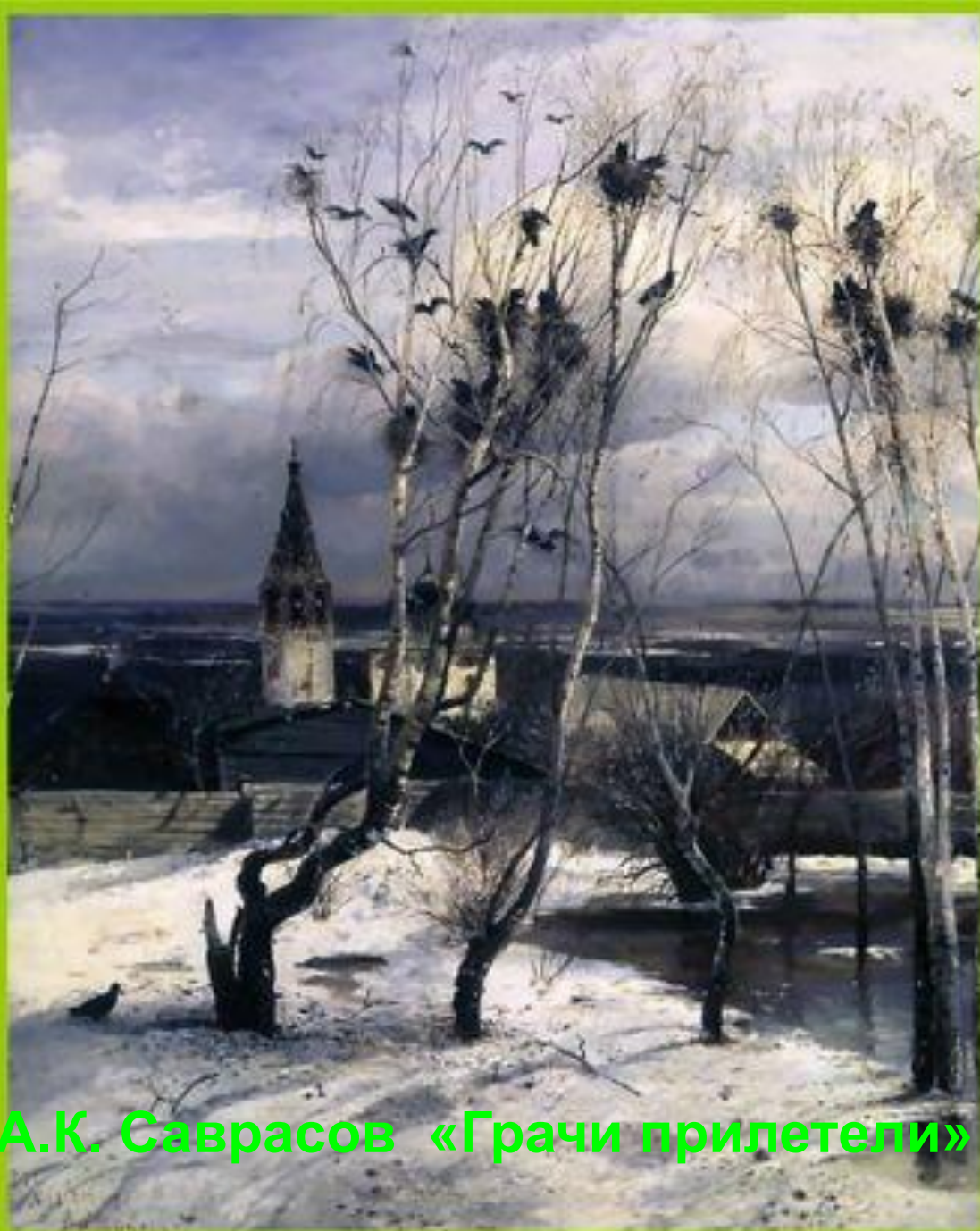
А.К. Саврасов «Грачи прилетели»