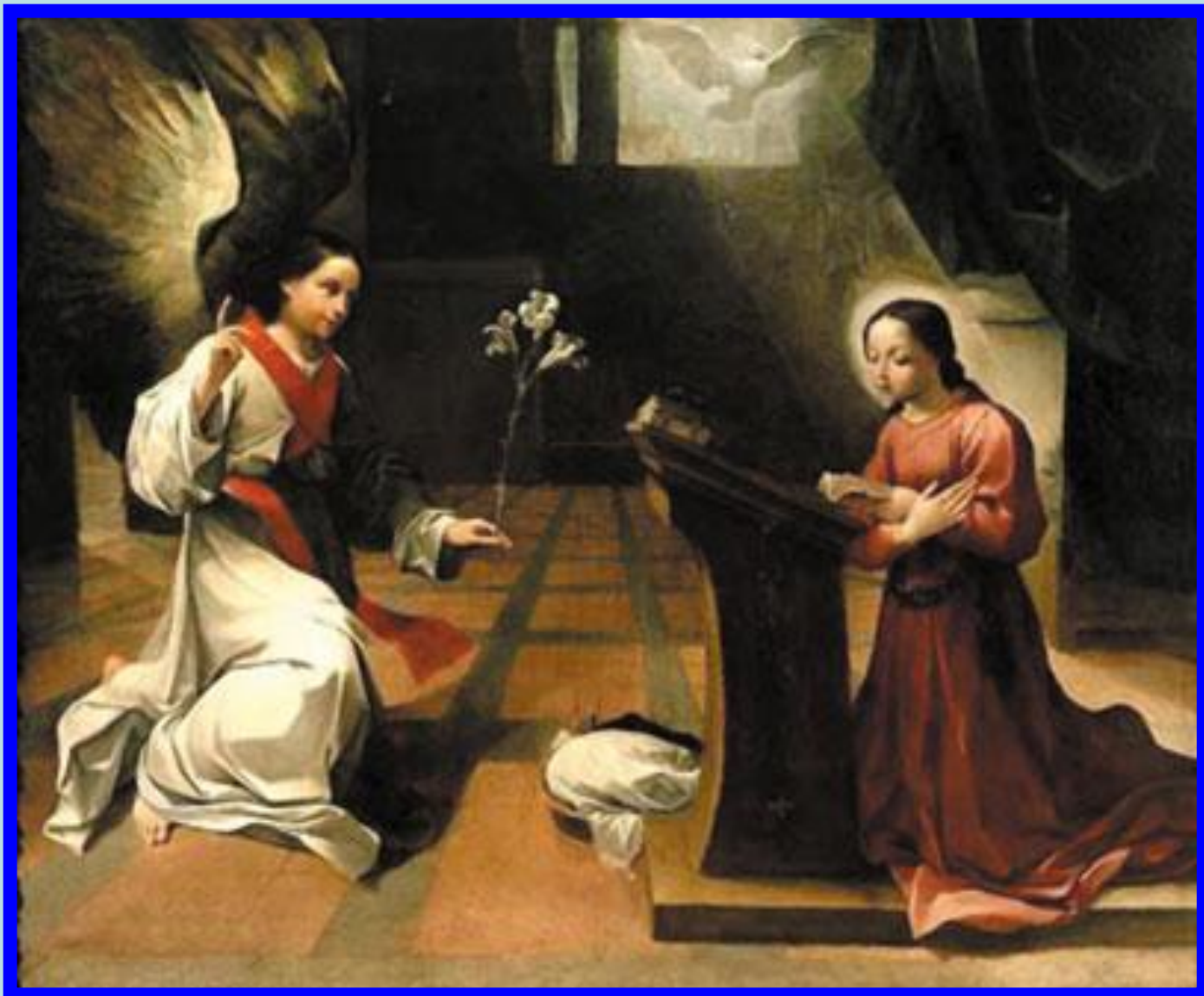
Архангел Гавриил принёс Марии благовест