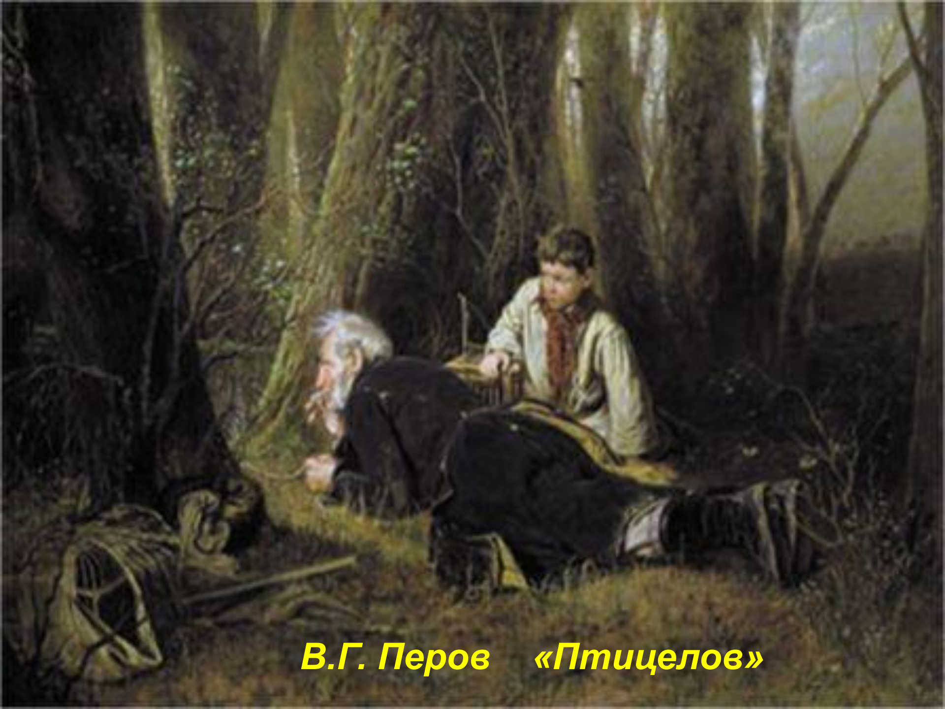
В.Г. Перов «Птицелов»