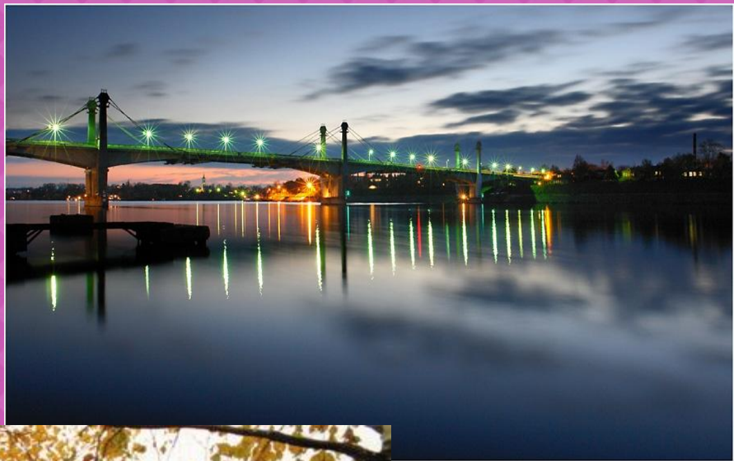
Мост через р.Волга