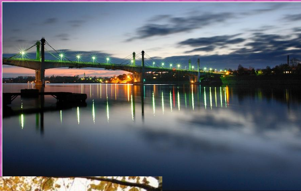
Мост через р.Волга