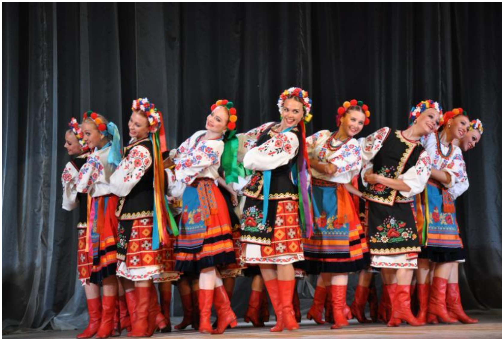
русский - народный танец: «Калинка-малинка»