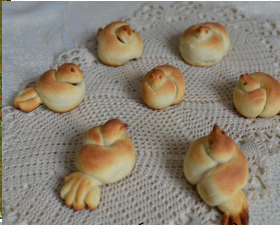
печеные жаворонки (кулики)