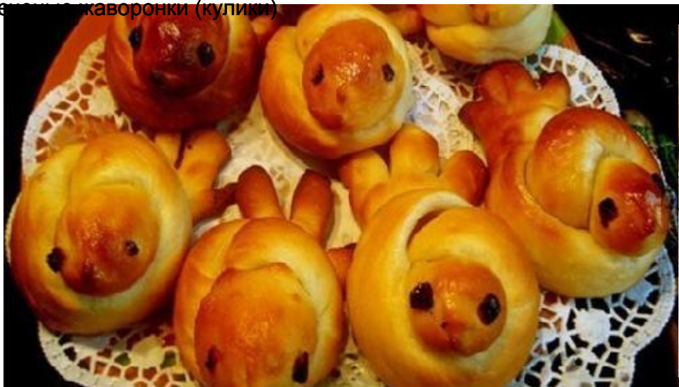
печеные жаворонки (кулики)