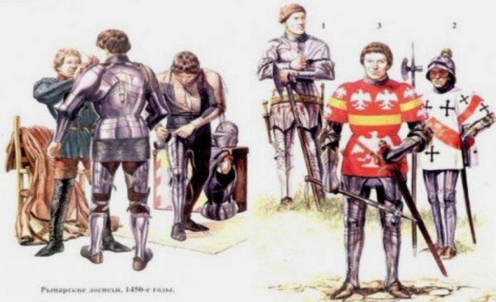
Рыцарские доспехи. 1450-е годы.