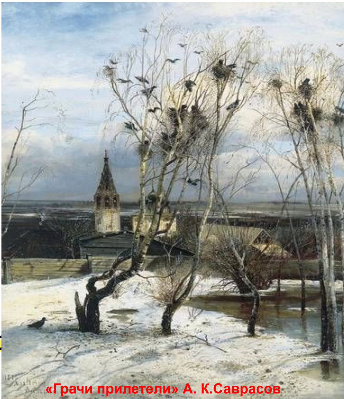
«Грачи прилетели» А. К.Саврасов