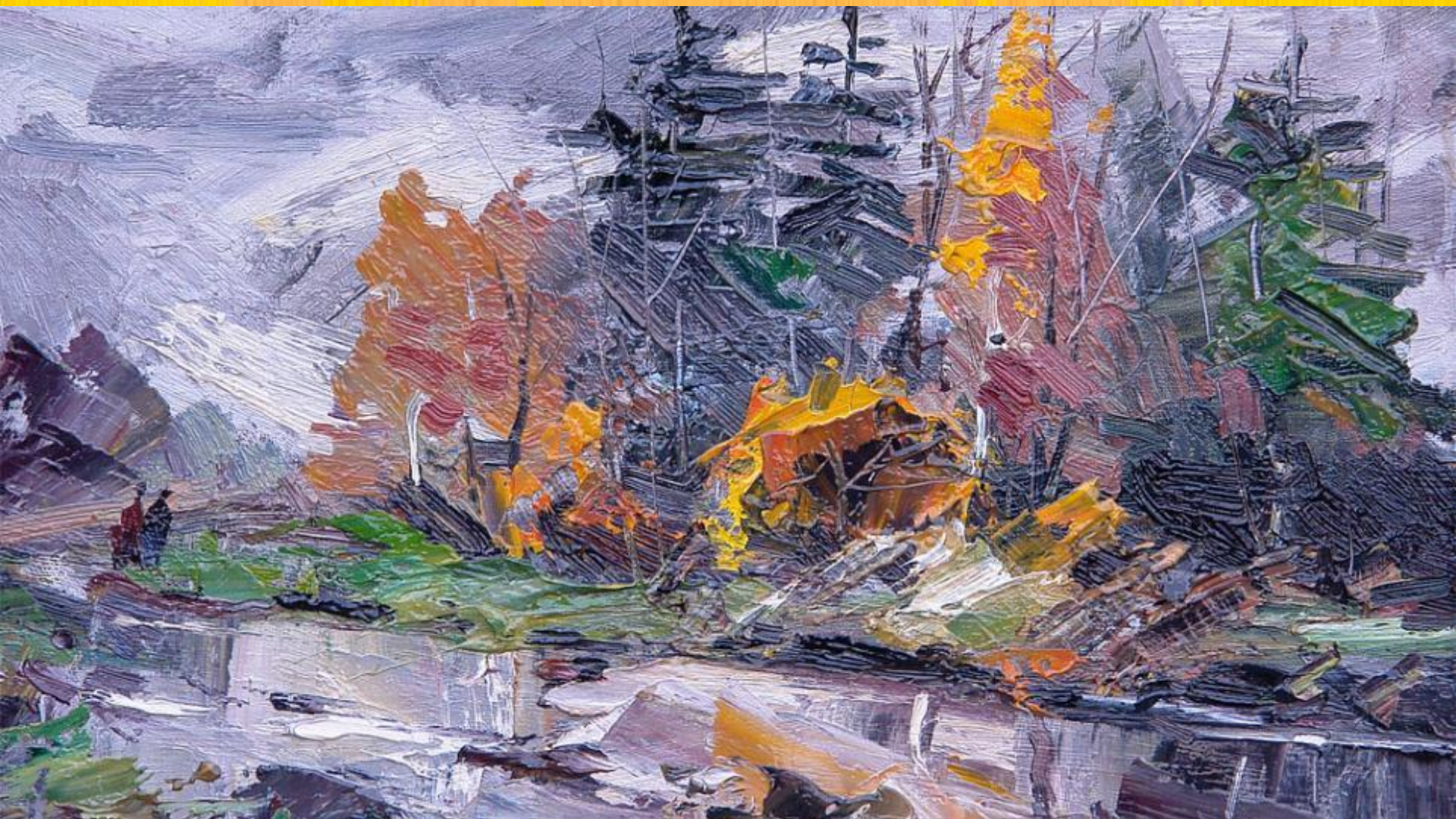
И.Агеев Поздняя осень