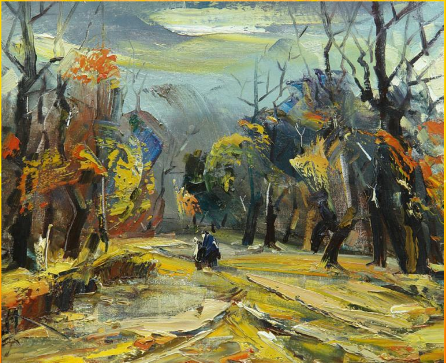
И.Агеев Поздняя осень