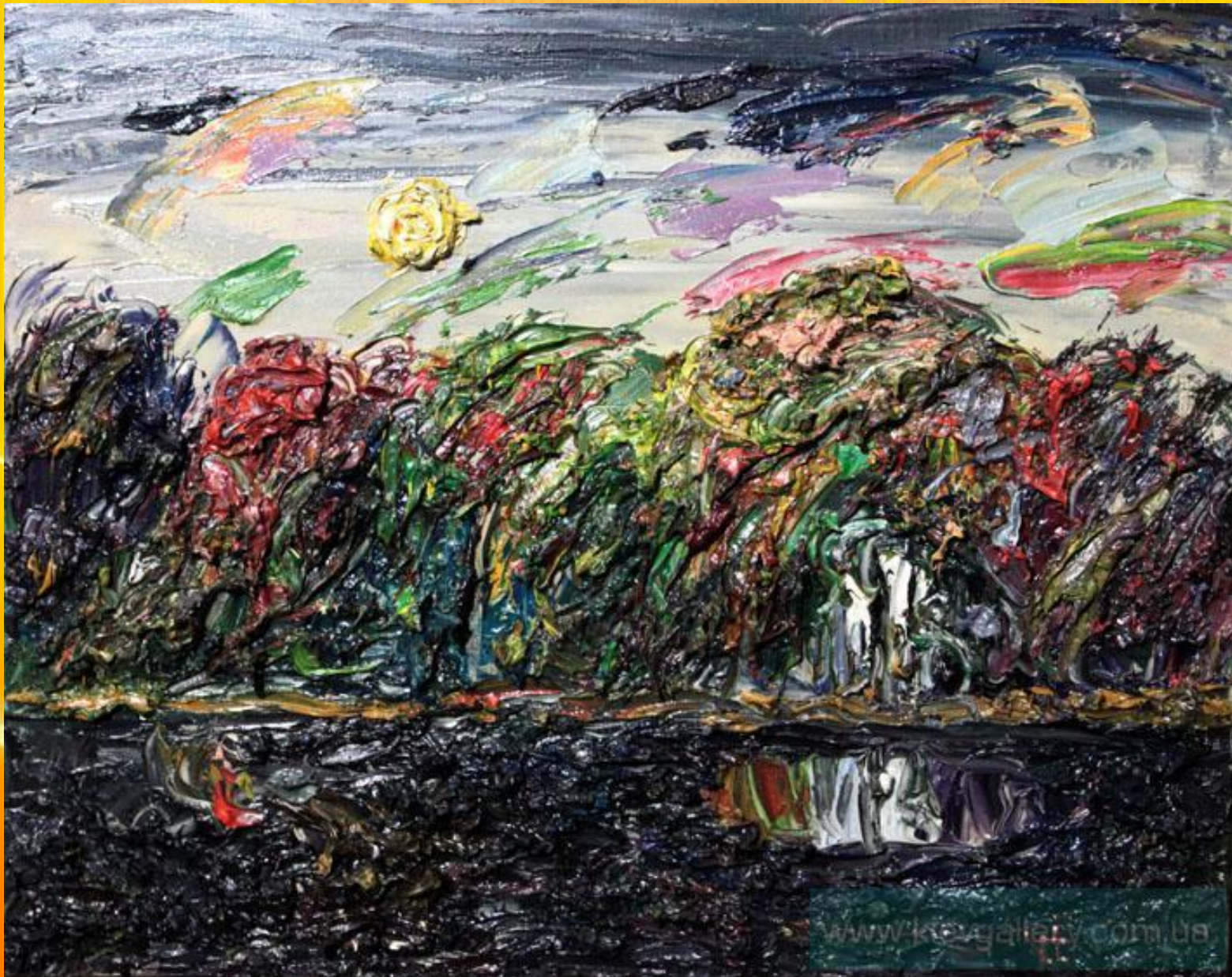
И. Иванив После дождя