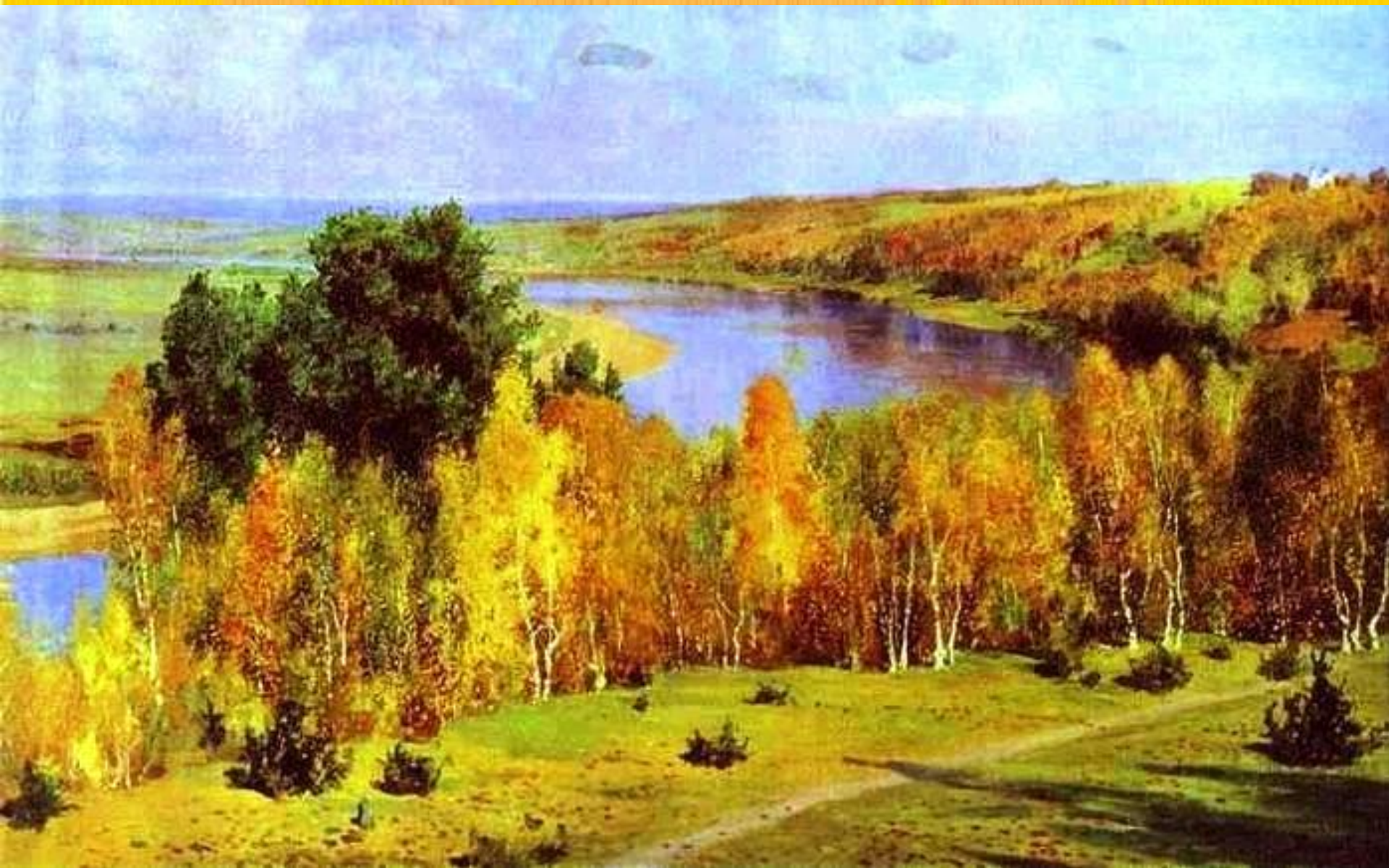
В.Поленов Золотая осень 1893 год