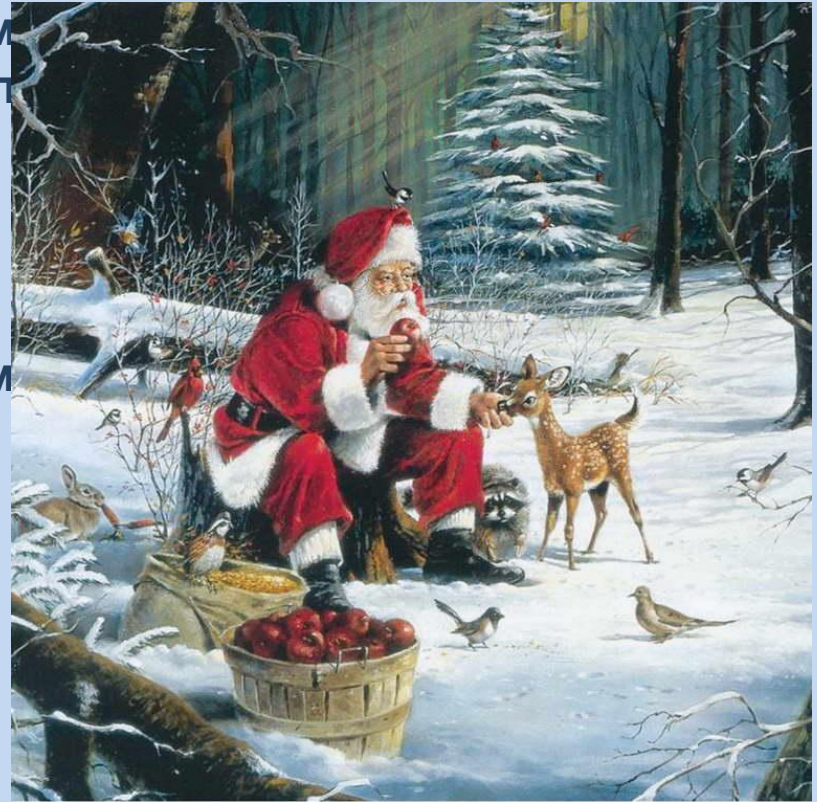
Баббо Натале - итальянский Дед Мороз.

В Италии Новый год начинается шестого января. Все итальянские ребятишки с нетерпением ждут добрую Фею Бефану. Она прилетает ночью на волшебной метле, открывает двери маленьким золотым ключиком и, войдя в комнату, где спят дети, наполняет подарками детские чулки, специально подвешенные к камину. Тому, кто плохо учился или шалил, Бефана оставляет щепотку золы или уголек. Обидно, но ведь сам заслужил!