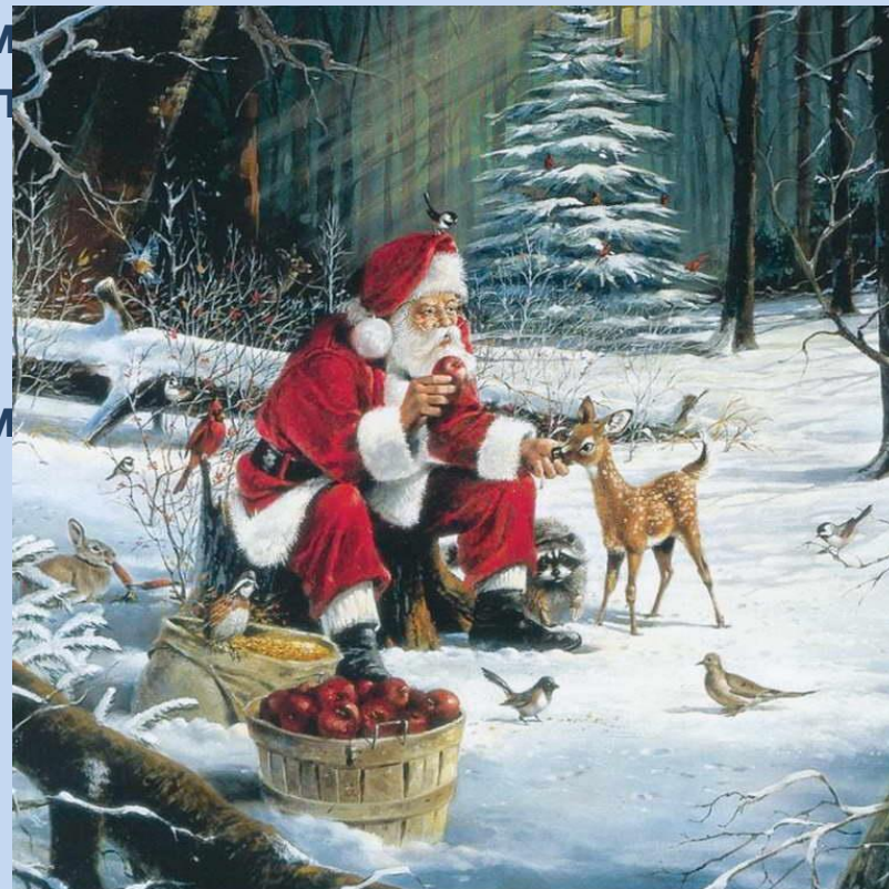
Баббо Натале - итальянский Дед Мороз.

В Италии Новый год начинается шестого января. Все итальянские ребятишки с нетерпением ждут добрую Фею Бефану. Она прилетает ночью на волшебной метле, открывает двери маленьким золотым ключиком и, войдя в комнату, где спят дети, наполняет подарками детские чулки, специально подвешенные к камину. Тому, кто плохо учился или шалил, Бефана оставляет щепотку золы или уголек. Обидно, но ведь сам заслужил!