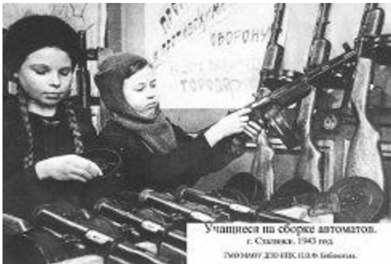
Учащице на сборке автоматов. г. Сталинек. 1943 год