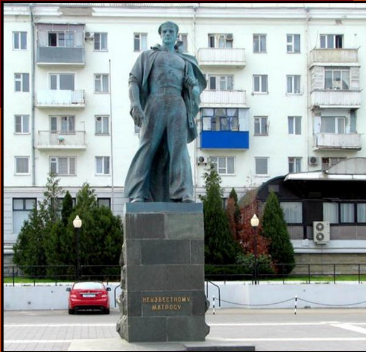
Памятник Неизвестному матросу г. Новороссийск, наб. Адмирала Серебрякова