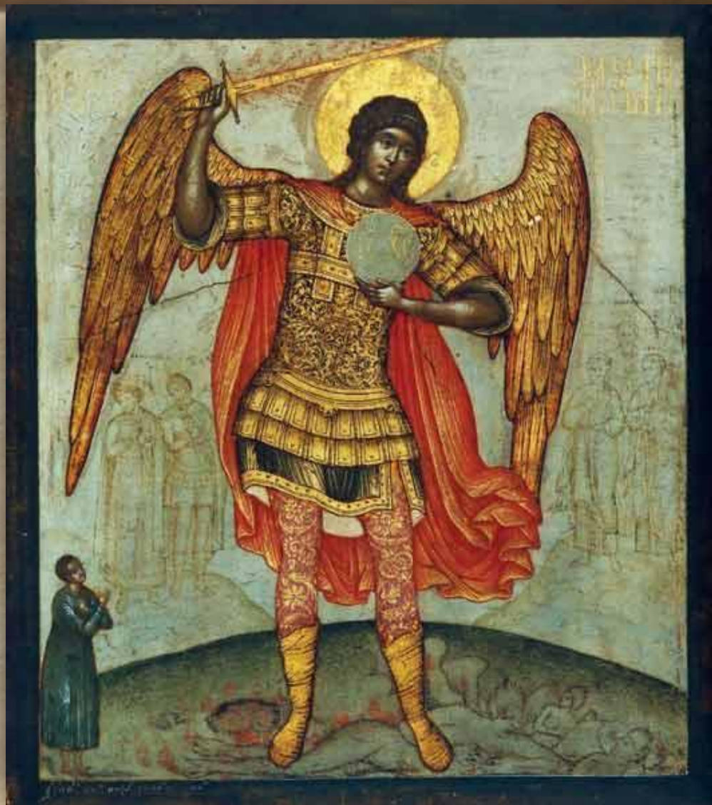
Архангел Михаил, попирающий диавола. Икона С. Ушакова. 1676. ГТГ