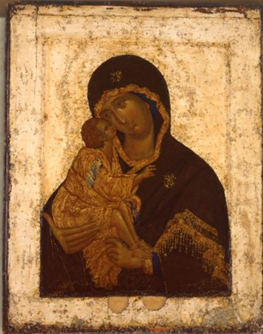
Богоматерь Донская. Икона. Феофан Грек. ГТГ.