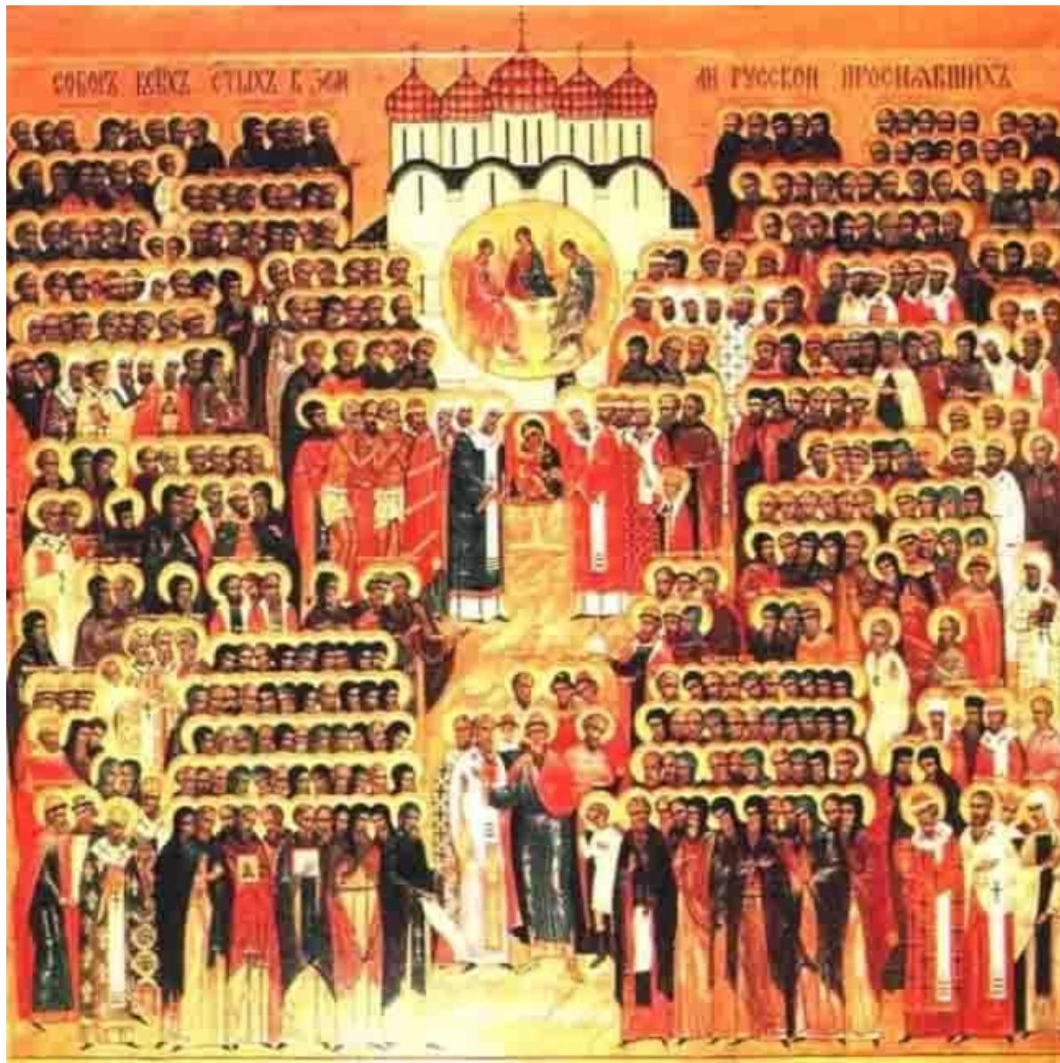
Икона Всех Святых, в земле Российской просиявших