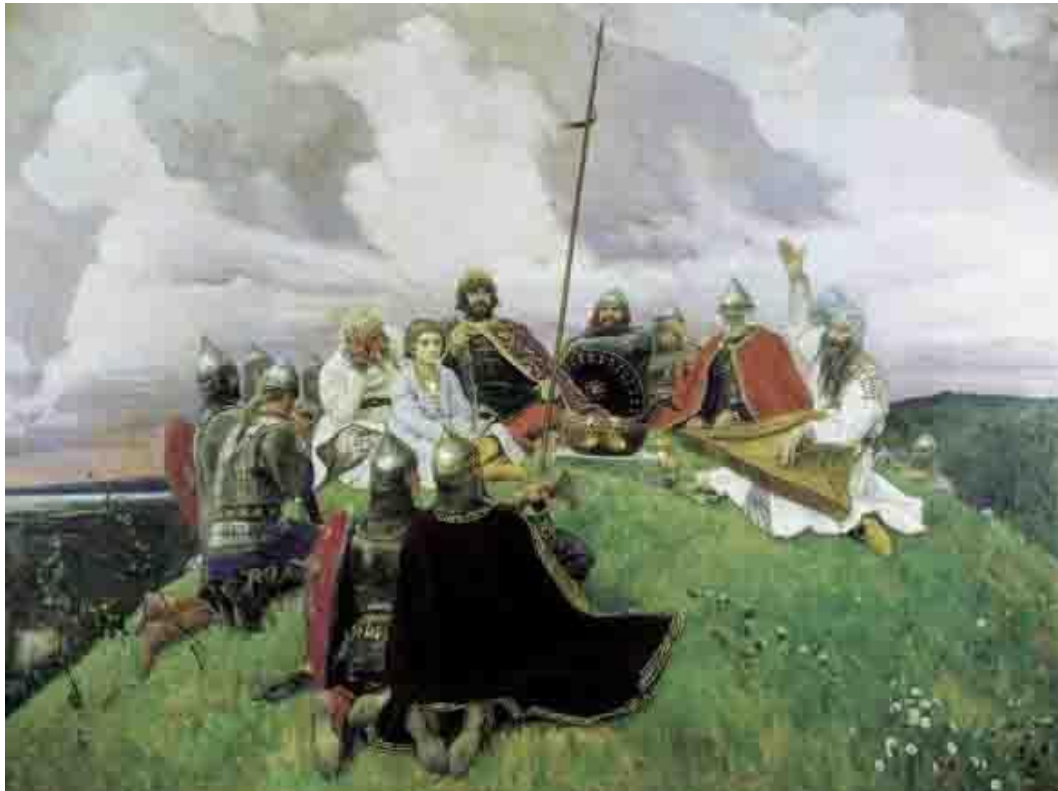
В.М. Васнецов. Баян

художников – И. И. Шишкина, И.И. Левитана, А.А. Иванова, В.М. и А.М. Васнецовых.