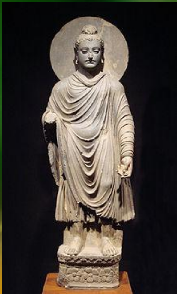
Стоящий Будда. Одно из ранних известных изображений Будды Шакьямуни