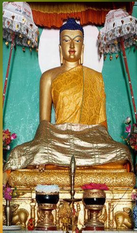
Статуя Сиддхартхи Гаутамы в Бодх- Гае, Индия. Бодх-Гая традиционно считают местом его просветления