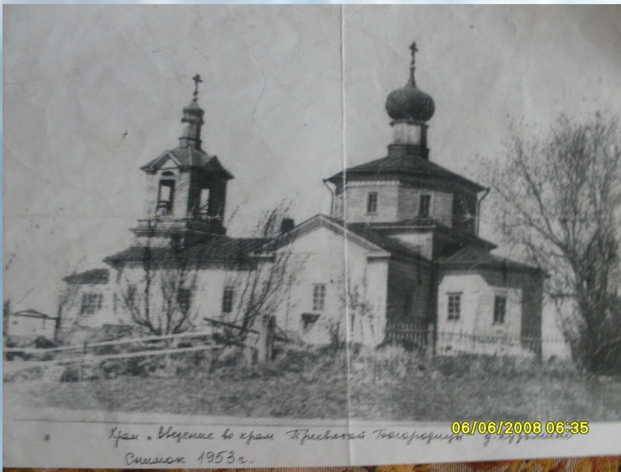
Храм «Введение во храм Пресвятой Богородицы» Симон 1953 г. 06/06/2008 06:35

Когда-то на Княжострове был большой деревянный храм. Церковь Введения во храм Пресвятой Богородицы, или Введенская летняя церковь с престолом во имя священномученика Власия была построена в 1644 году. Одновременно в деревне был освящён ещё один тёплый шатровый храм в честь великомученицы Екатерины, но он сгорел, а Введенский храм разобрали за ветхостью. В 1857 г. все три престола объединили под одной крышей и сделали храм тёплым.