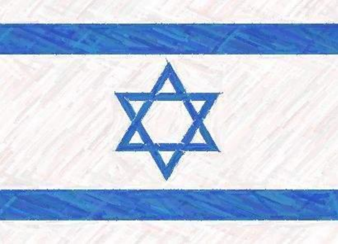
Флаг Государства Израиля