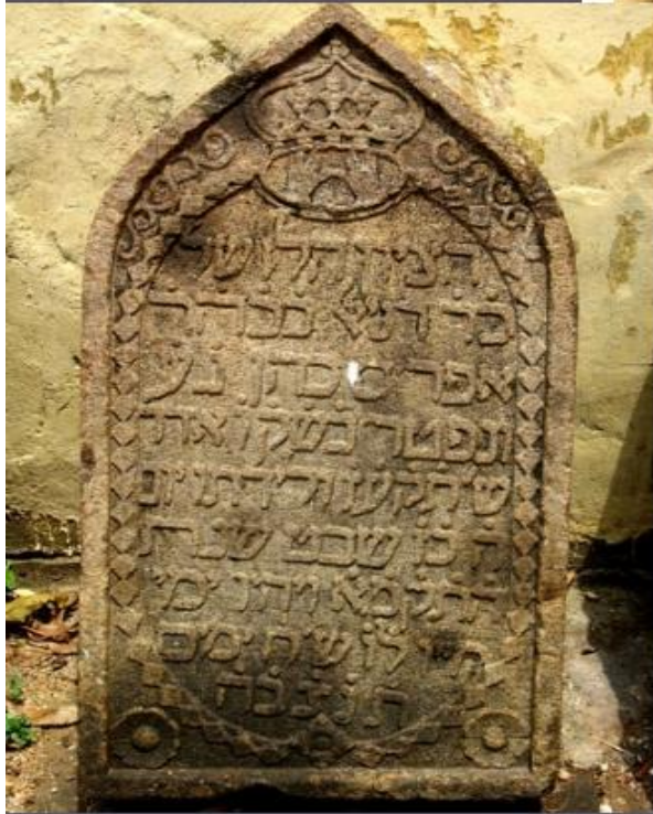
Плита с Десятью заповедями