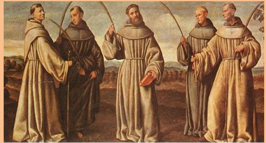
B. Licinio: Los Mártires franciscanos de Marruecos