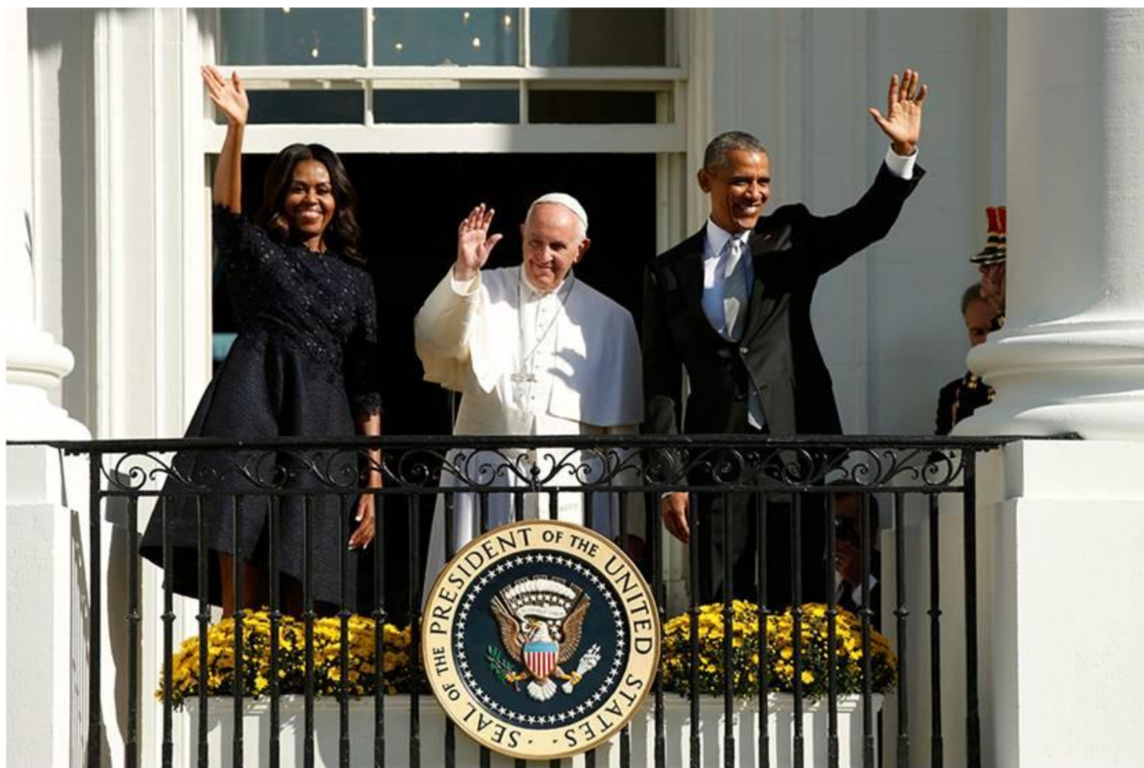
Балкон Белого дома 14 сентября 2015г.