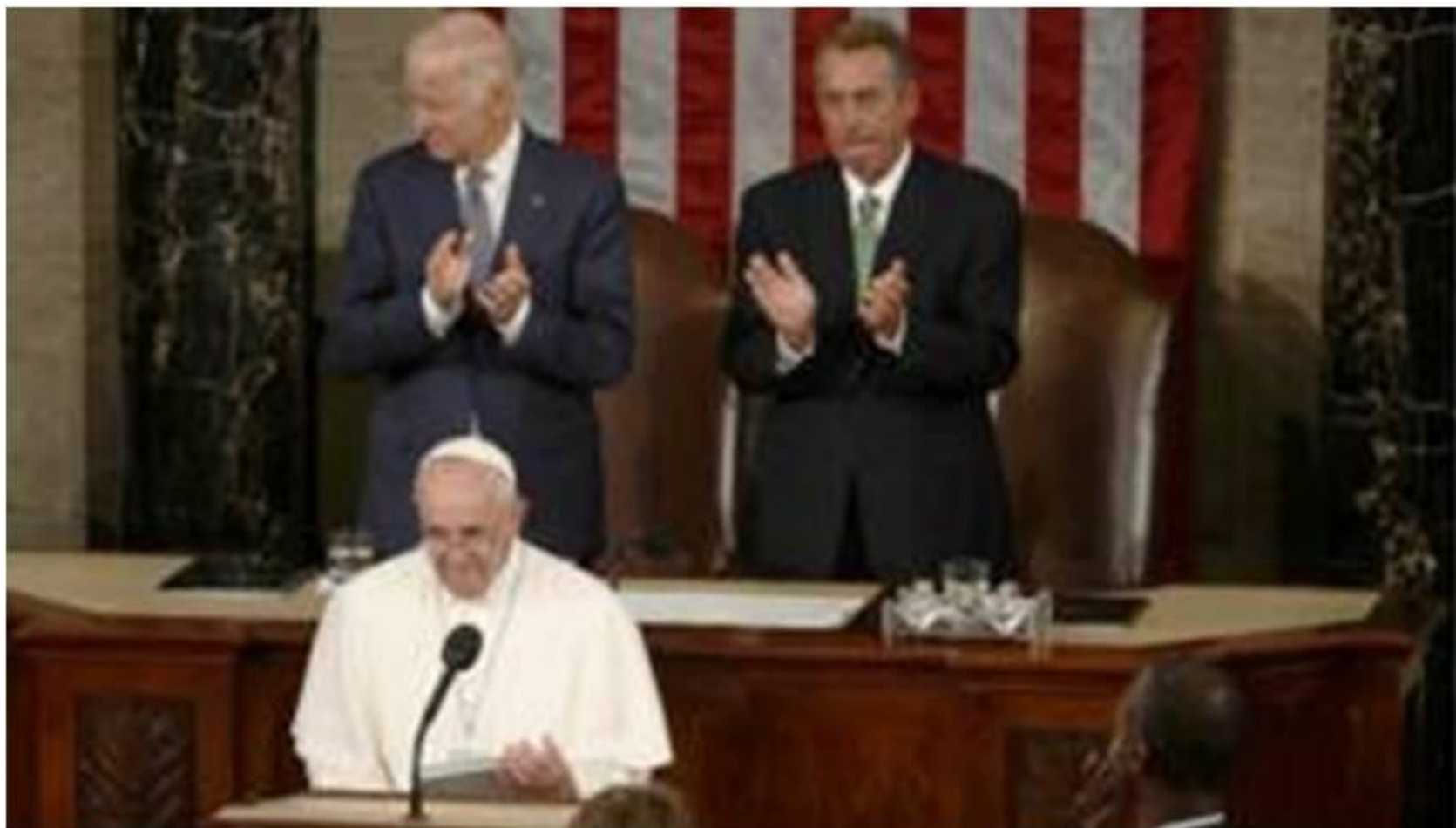
Папа в Конгрессе США