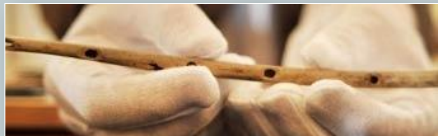
Древнейшая флейта из полый кости грифа. 40-35 тыс. до н.э.