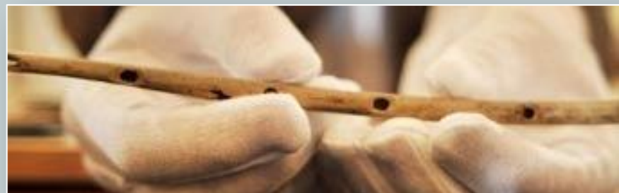
Древнейшая флейта из поллой кости грифа. 40-35 тыс. до н.э.