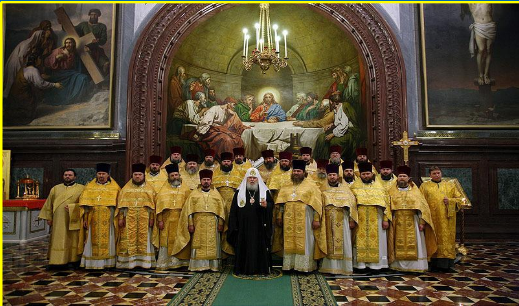
Встреча патриарха Алексия 2 с иереями.