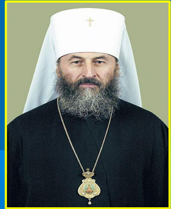
Митрополит Украинский Онуприй