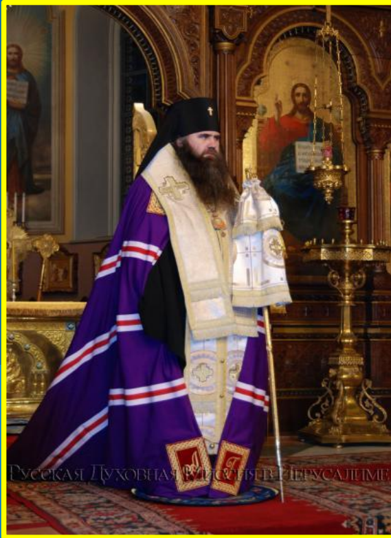
Митрополит Нижегородский Георгий