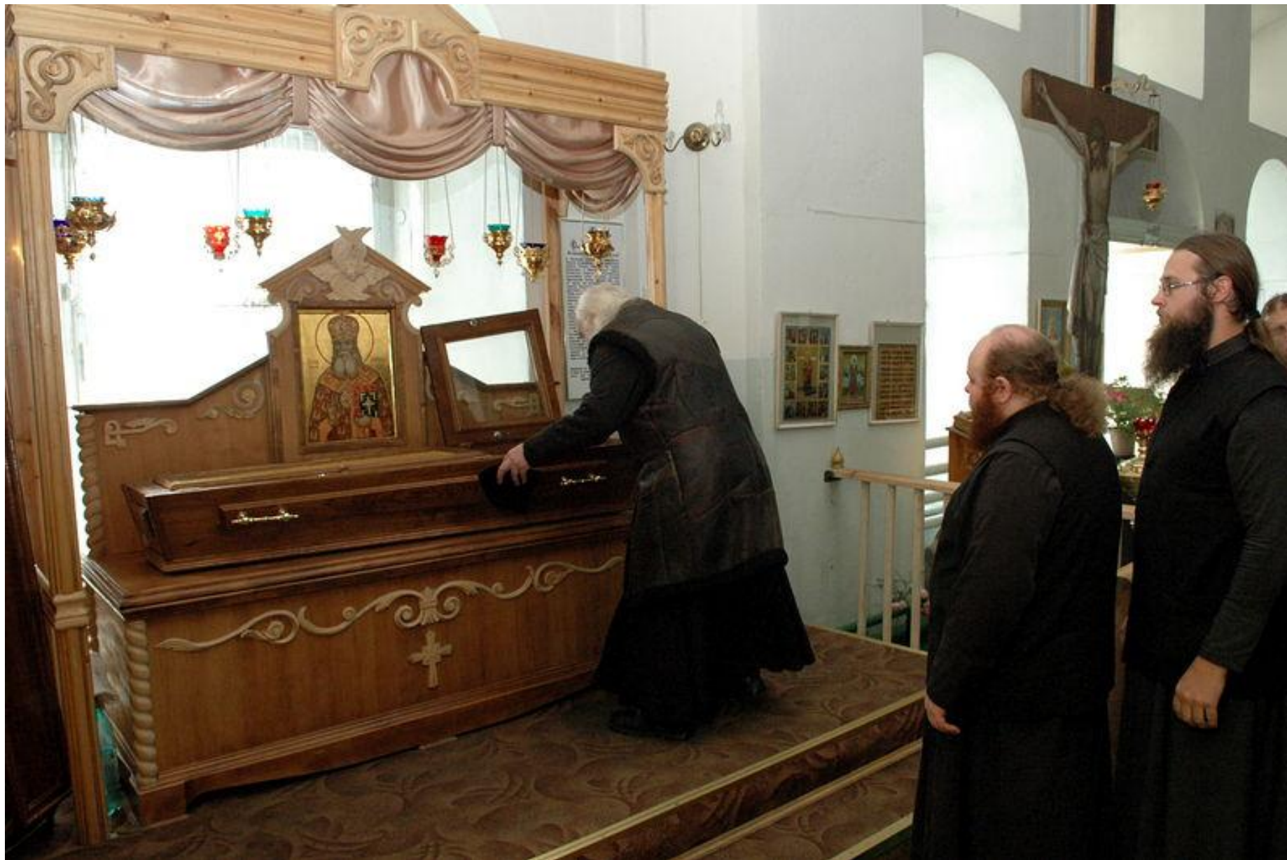
У мощей священноисповедника Агафангела. Ярославль, Казанский монастырь