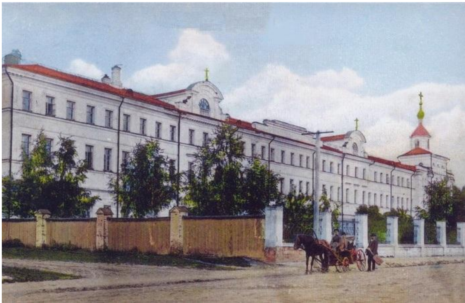
Тульская Духовная Семинария

В 1871 году юноша поступил в Тульскую Духовную семинарию.