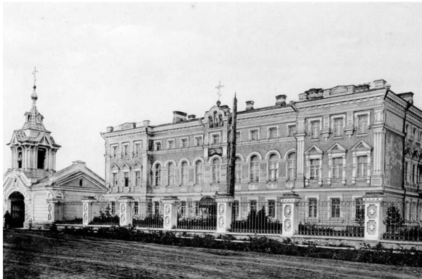
Томская Духовная Семинария

7 марта 1885 года Александр Лаврентьевич принимает монашеский постриг с именем Агафангел (в память мученика IV века, ученика священномученика Климента Анкирского), а затем принимает сан иеромонаха.