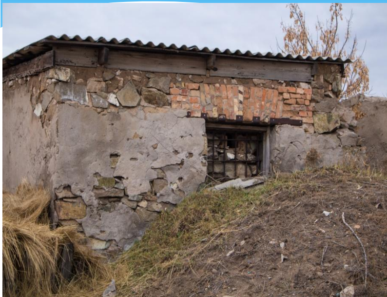
Фото сохранившейся части карцера в селе Есенгельды. Самарское отделение Карлага.