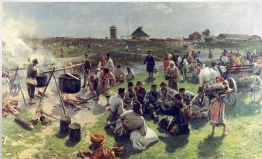
И. Прянишников. Сельская братчина