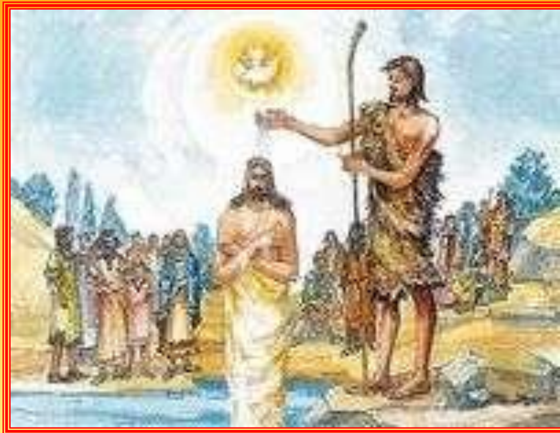
Chrzest Pana Jezusa w Jordanie