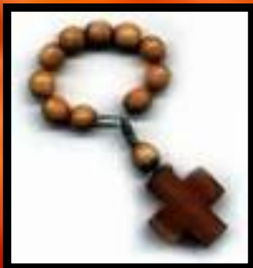
DZIESIĄTKA RÓŻAŃCA ŚW.