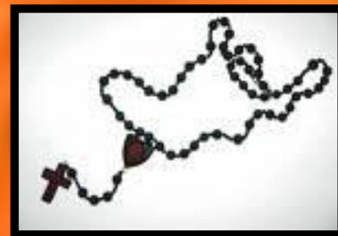
TRADYCYJNY WYGLĄD RÓŻAŃCA DO ODMAWIANIA 1 CZEŚCI – 5 TAJEMNIC