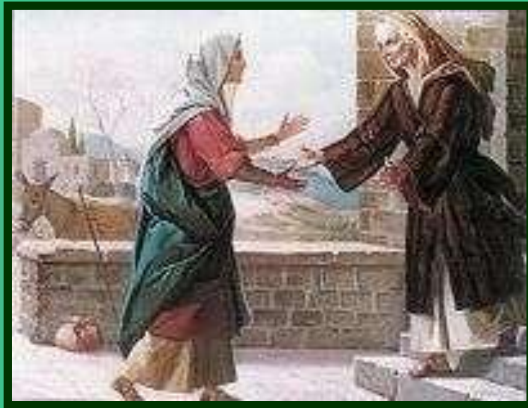
Nawiedzenie Świętej Elżbiety.