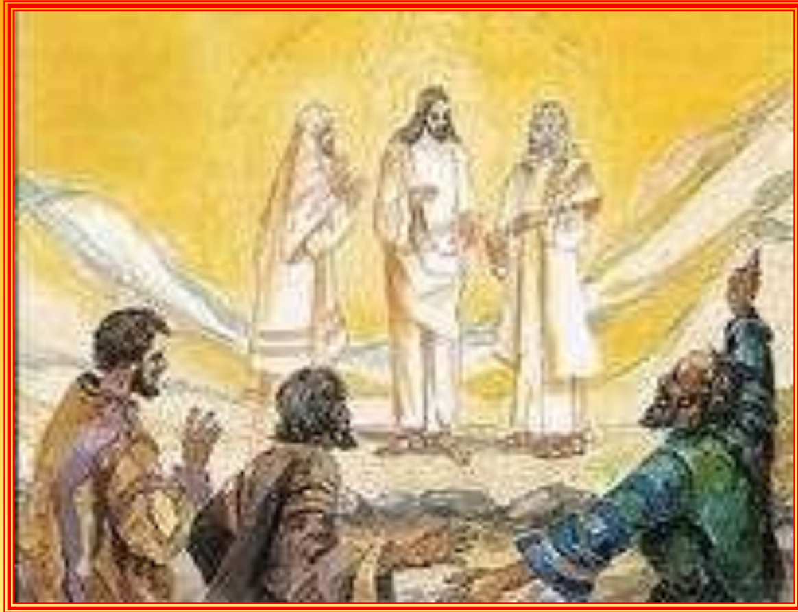
Przemienienie Pana Jezusa na górze Tabor