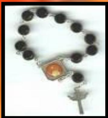
DZIESIĄTKA RÓŻAŃCA ŚW.