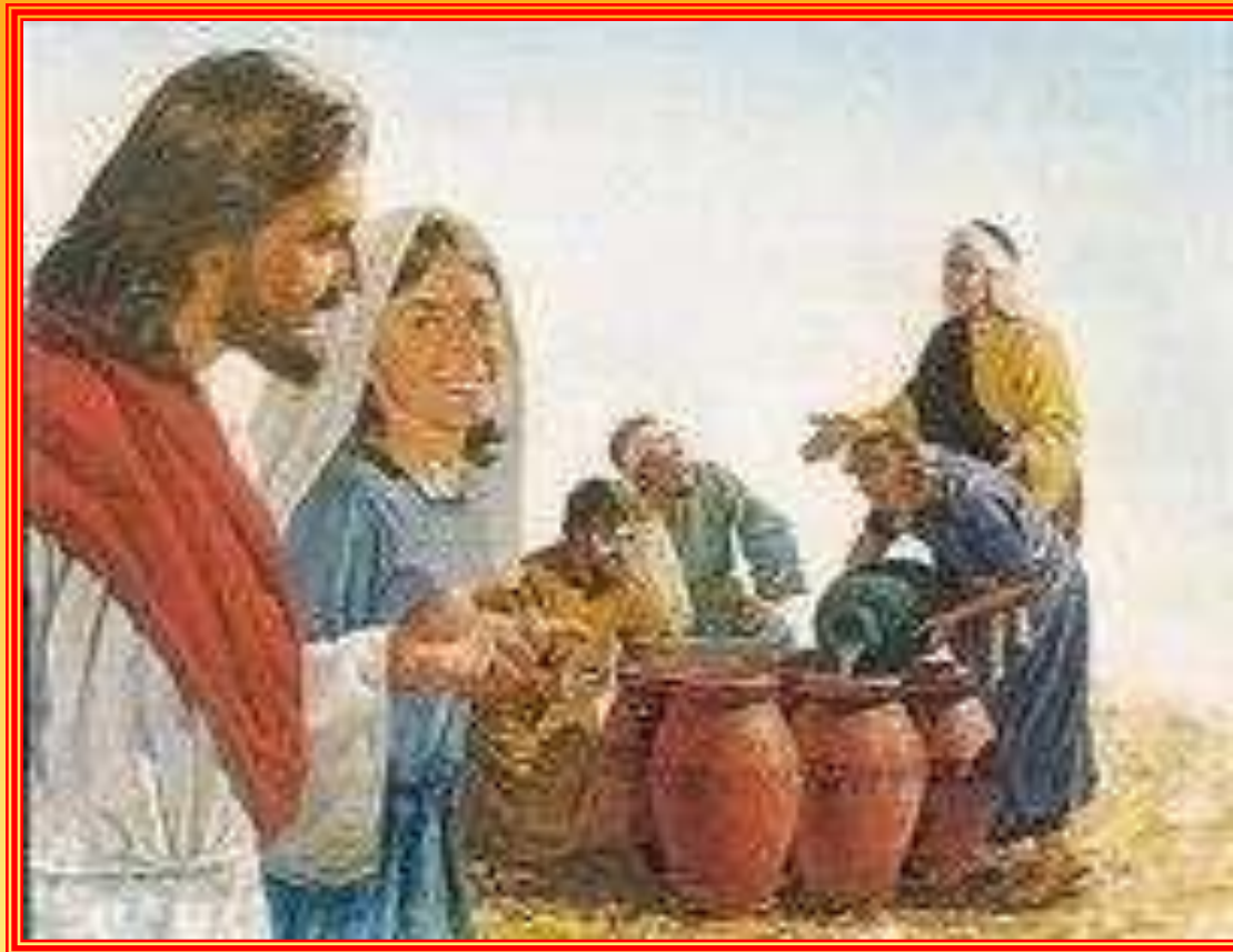
Cud w Kanie Galilejskiej