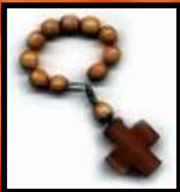
DZIESIĄTKA RÓŻAŃCA ŚW.