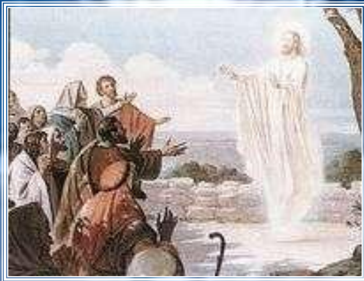
Wniebowstąpienie Pana Jezusa