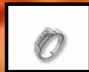
PIERŚCIONEK Z DZIESIĄTKĄ RÓŻAŃCA