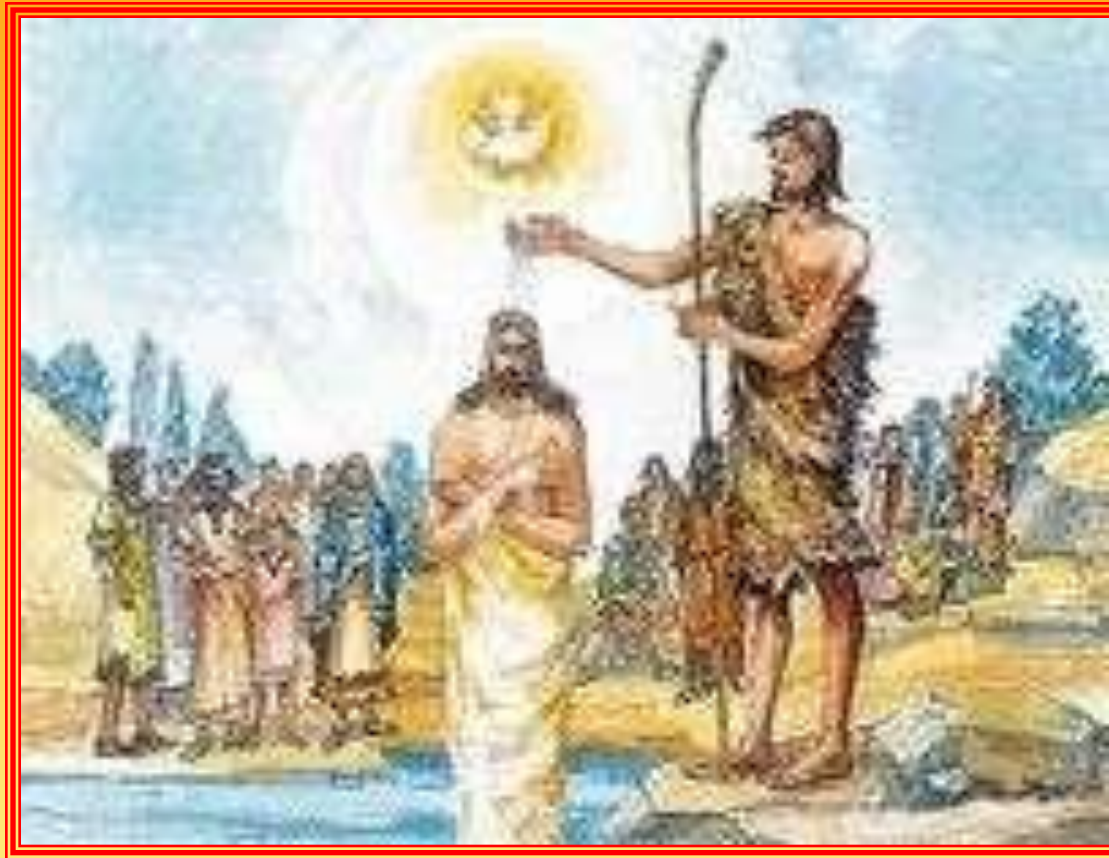
Chrzest Pana Jezusa w Jordanie