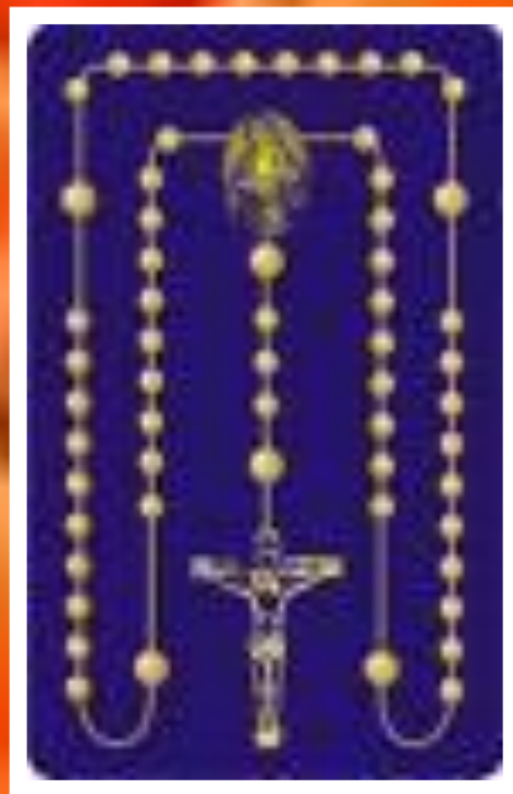
KARTA Z WYPUKŁYMI KORALIKAMI DO 1 CZEŚCI RÓŻAŃCA