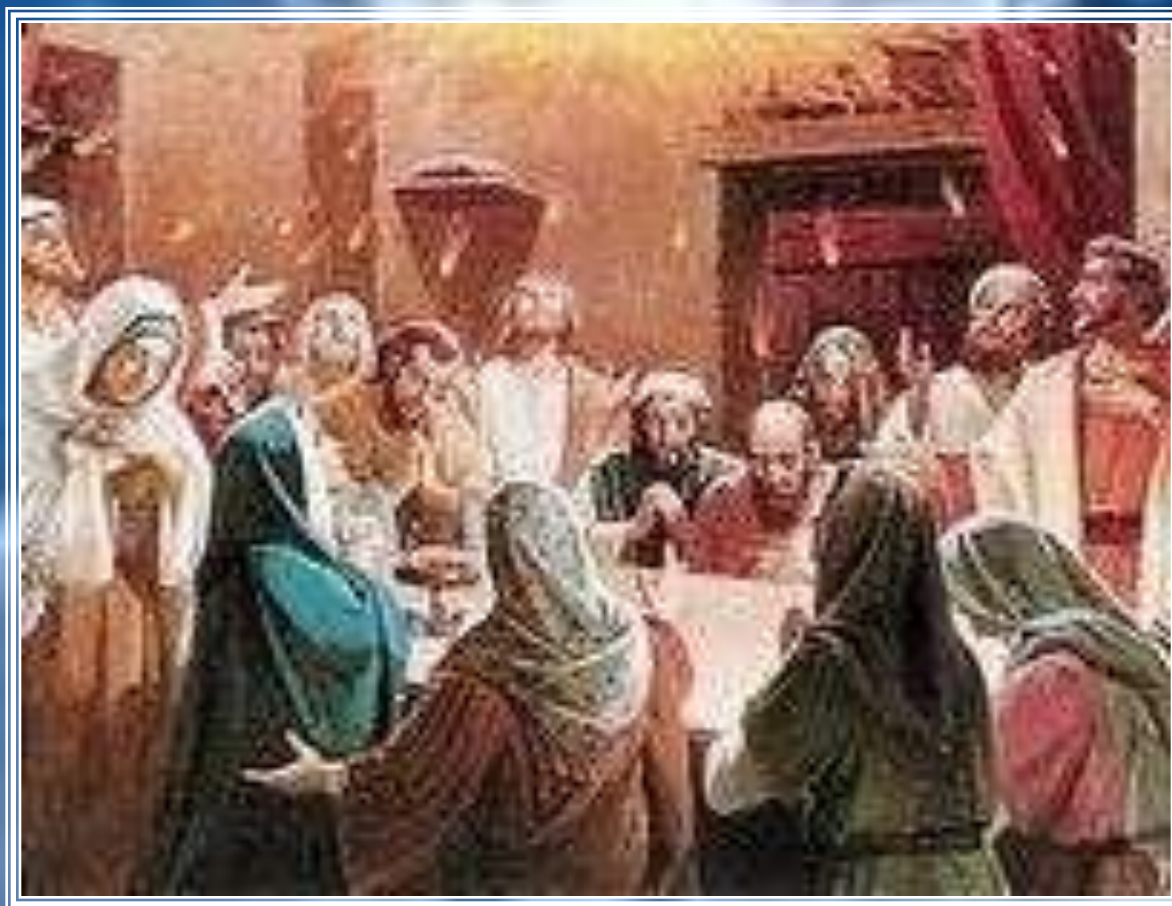
Zesłanie Ducha Świętego