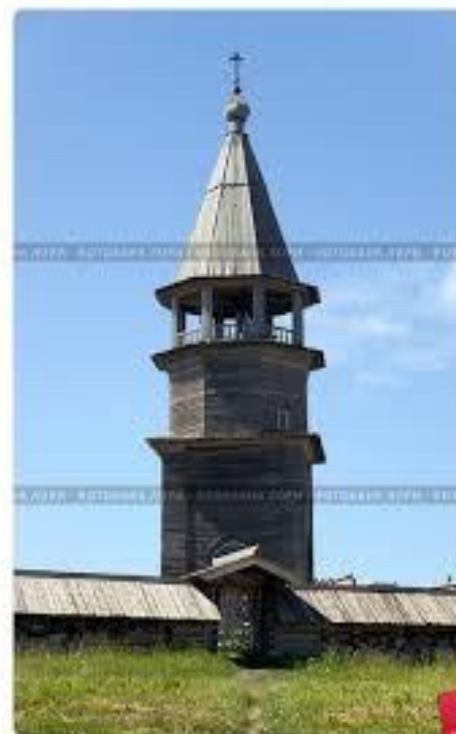
Восток Южн. Киевский псалом. Деревянная шатровая колокольня.