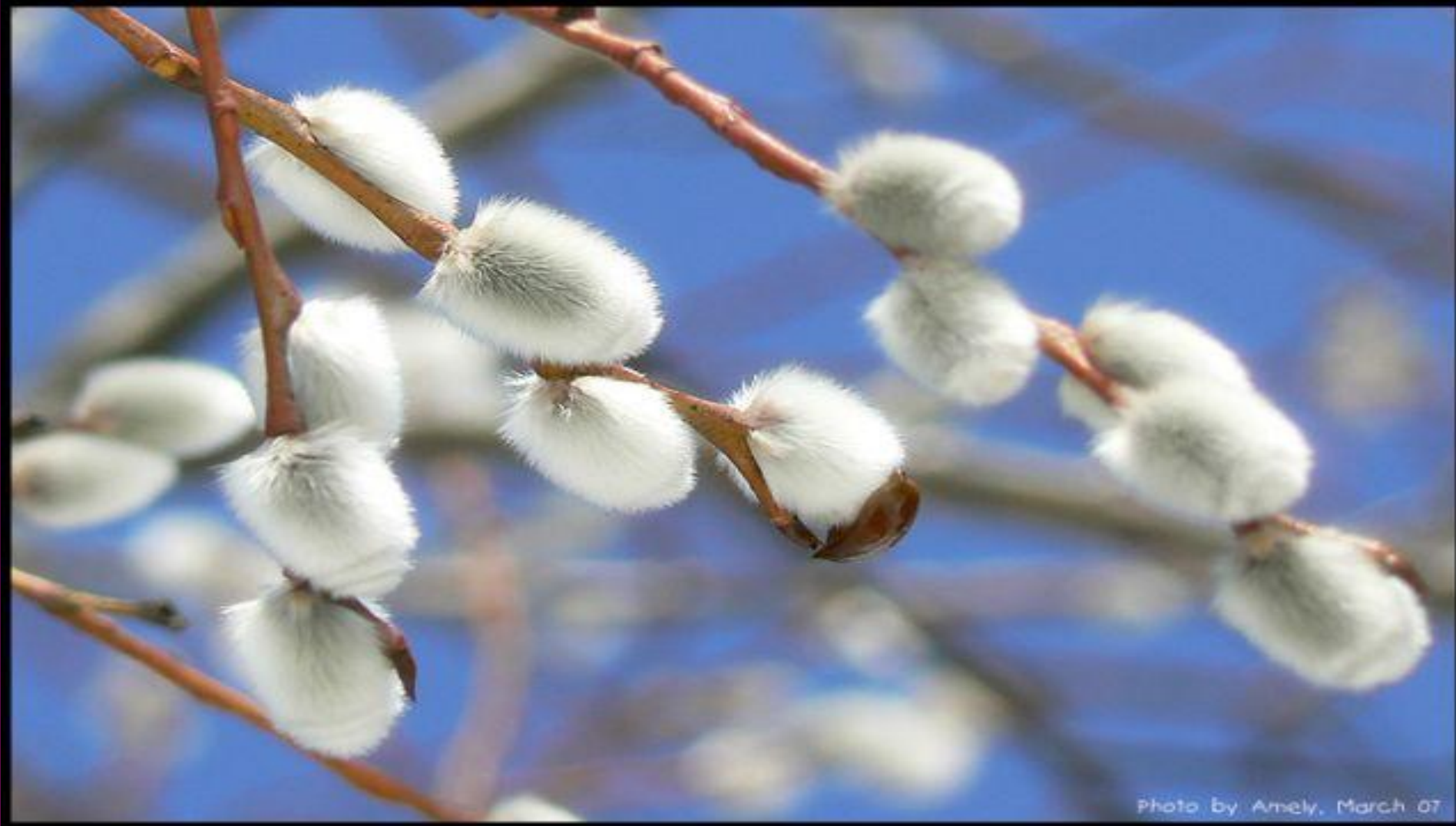
March 07