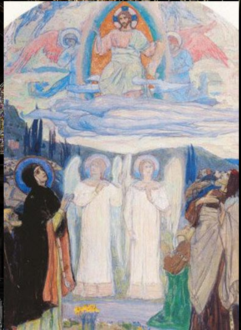
Вознесение Господне. М. В. Нестеров. 1898 г.

Каждый этап в истории русской религиозной живописи в XVIII столетии неизбежно перекликался с общими тенденциями в развитии искусства и отражал черты его художественного облика.