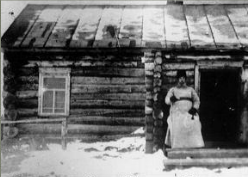
Митрополит Петр (Полянский) в пожизненной ссылке. Пос. Хэ Обдорского р-на (?)