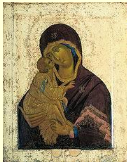
Донская икона Божией Матери