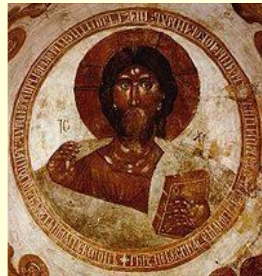
Спас Вседержитель. Роспись купола церкви Спаса Преображения на Ильине улице в Великом Новгороде. 1378 г.