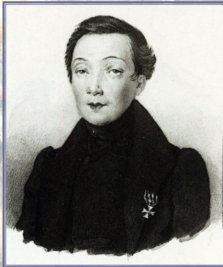
Н. А. Дурова. 1830-е гг. Портрет работы А. Брюллова