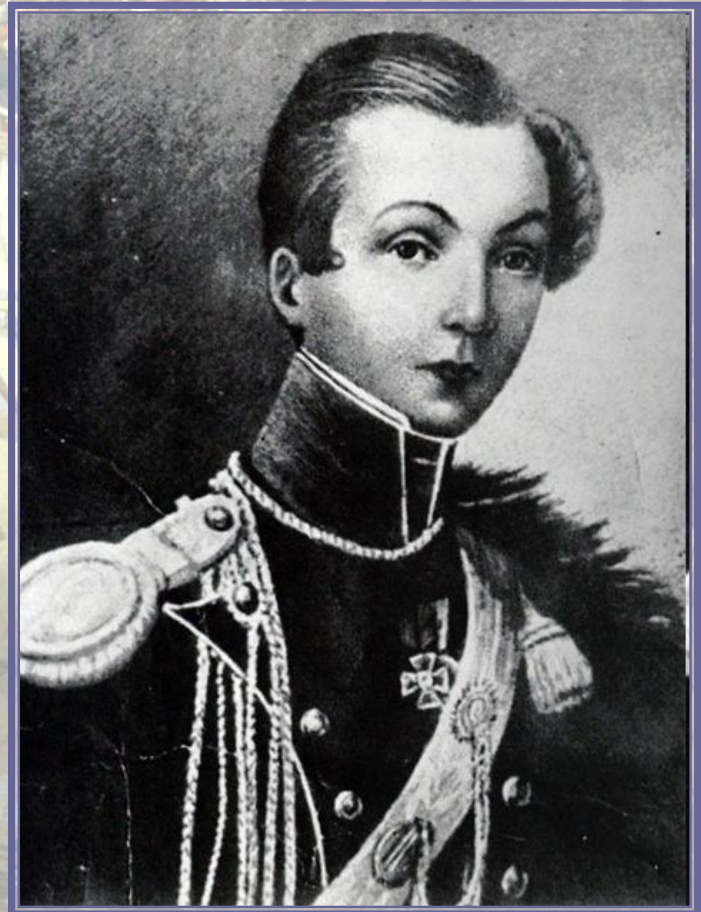
Портрет Н.А. Дуровой в уланском мундире. Неизвестный художник