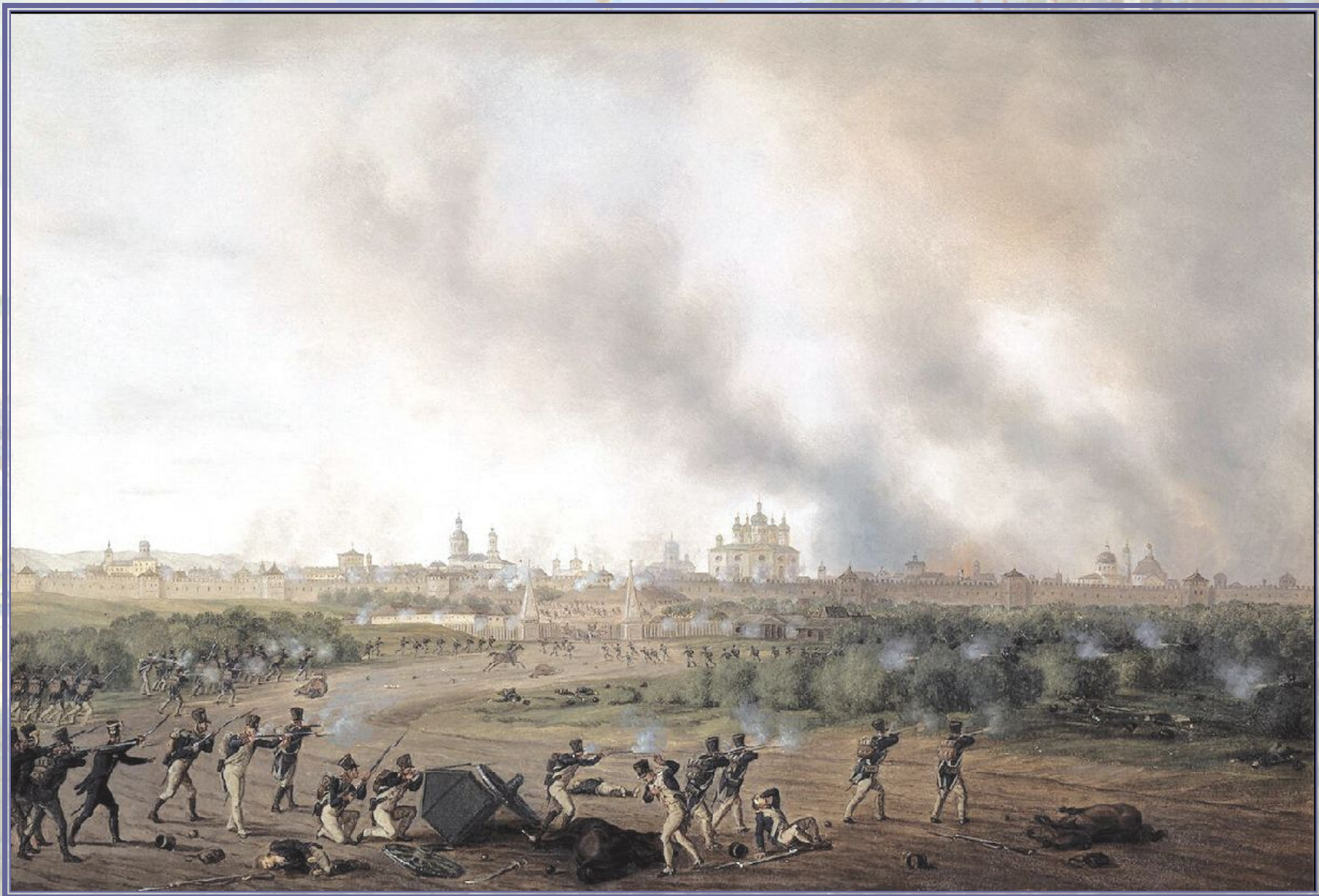
Альбрехт Адам. Сражение за Смоленск 18 августа 1812 г. (Между 1815–1825)