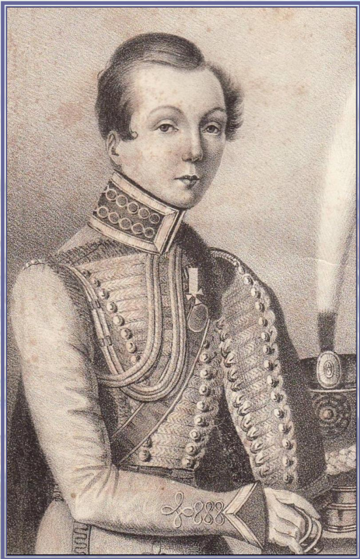
Портрет Н.А. Дуровой в гусарском мундире. Неизвестный художник